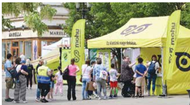
A MOHU standján is tájékozódhattak a látogatók

Mint a cégvezető elmondta, az előttük álló évtized egyik legfontosabb célja, hogy a háztartásokban kelet-