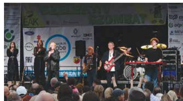
Az esemény esti programjának fő fellépője a Bikini együttes volt

megfelelően tudjuk kezelni a hulladékot. Ami azt jelenti, hogy a kibocsátott hulladék hatvanöt százalékát újrahasznosításra át tudjuk adni. Csak tíz százalék maradjon lerakásra, a fennmaradó részt pedig valamilyen formában kezelni kell, komposztálni, vagy termikus hasznosításra