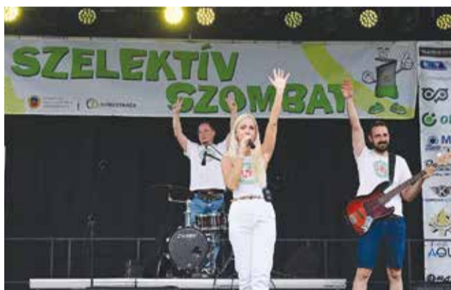
A Vidám Manók együttes műsora is színesítette a programot

Szelektív Szombat elsősorban a családokat szólítja meg. Célja, hogy átadja számukra a szelektív hulladékgyűjtés helyes gyakorlatát. Ezzel a saját hatékonyságunkat is növelhetjük, hiszen minél pontosabban gyűjti a lakosság a hulladékot, annál eredményesebben tudjuk azt feldolgozni. Korszerű gyűjtőedényekkel, gépekkel és hul-