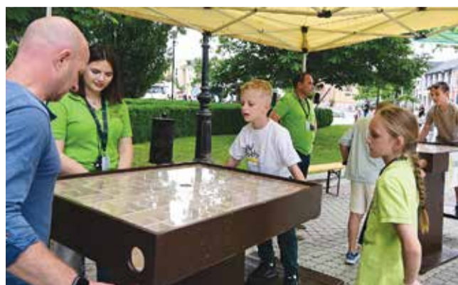
A gyerekek játék közben ismerkedhettek a környezettudatos szemlélettel

keletkezés pillanatában eldől. Amikor egy tárgy haszontalanná válik, akkor kell eldöntenünk, melyik kukába dobjuk. A hulladék a háztartásokban keletkezik, ezért a