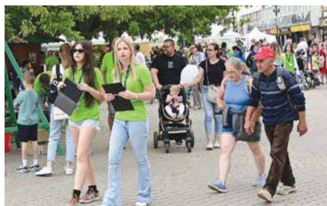
A Kossuth tér megtelt családokkal és érdeklődőkkel a 16. Szelektív Szombaton

Több mint másfél évtizedes múlttra tekint vissza a családi nap, amely a háztartási hulladék kezelésének fontosságáról szól. – A szemét sorsa tulajdonképpen már a