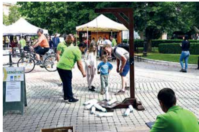
Változatos játékok várták a gyerekeket

– Az Európai Unió átlagának csak a felét hasznosítjuk újra, tehát Magyarországon a szemét-újrahasznosítás – mondjuk úgy – még gyerekcipőben jár. Jó lenne ezt tökélyre fejleszteni. Ezek a napok erre alkalmasak, hogy mindenkiben tudatosuljon: vége annak, hogy mindent egy kukába dobunk. Szedjük szét, mert a szemét