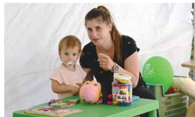
A rendezvény egyik fontos célja az volt, hogy a legkisebbekhez is eljusson a környezettudatos szemlélet

kező hulladék kezelése teljes mértékben megfeleljen az Európai Unió előírásainak. – Szeretnénk elérni azt a szintet, hogy 2035-re az európai uniós előírásoknak