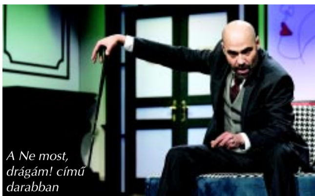
A Ne most, drágám! című darabban

– Így van megírva, és rendezői koncepció is ezt támasztja alá. De változtattunk rajta kicsit a bemutató után, elhagy-