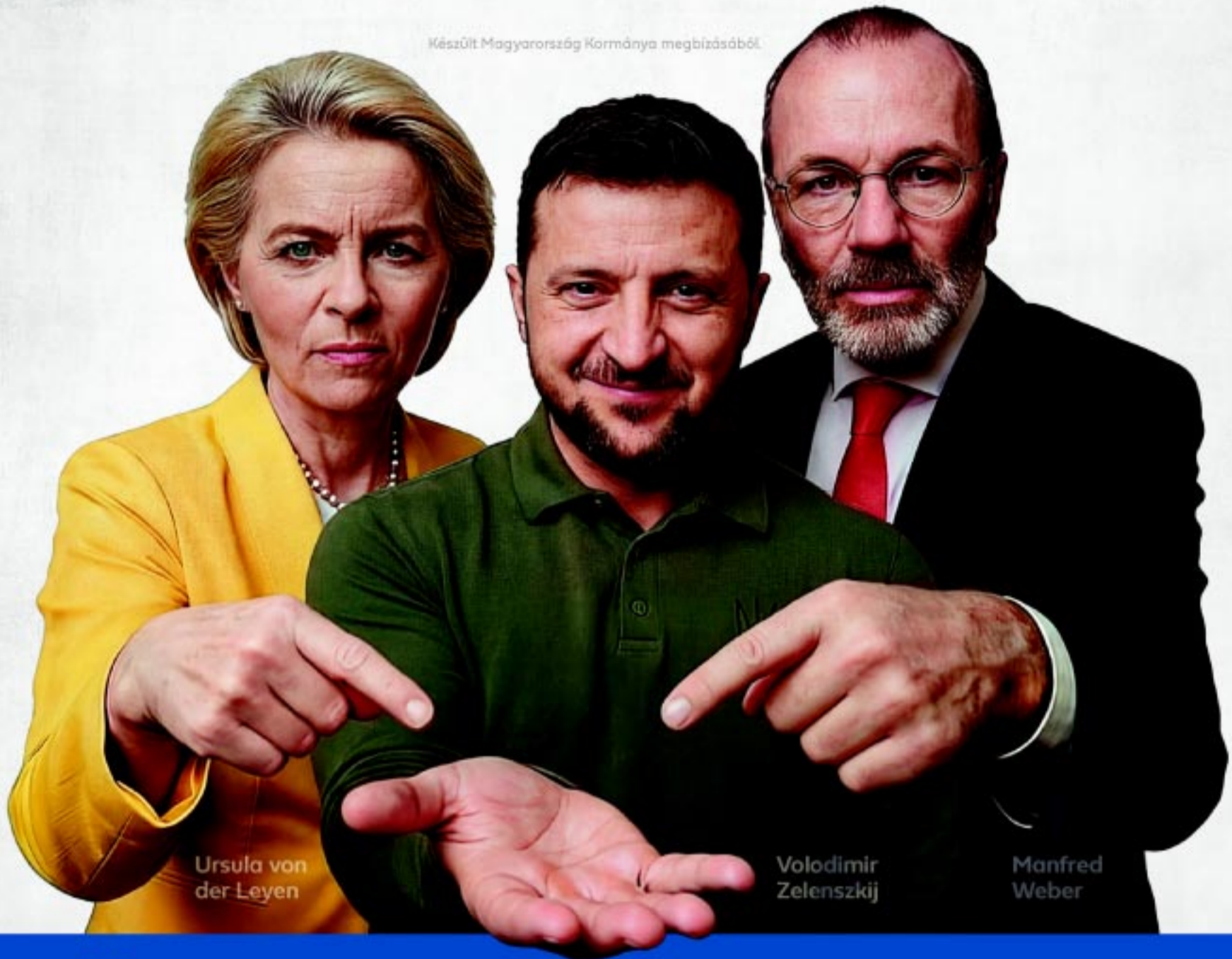
Ursula von der Leyen

Készült Magyarország Kormánya megbízásából.