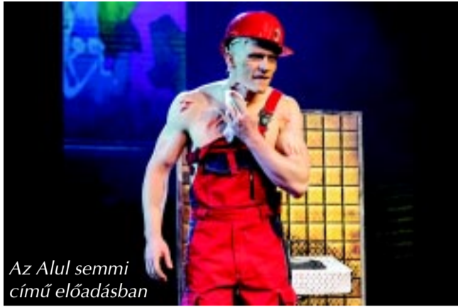
Az Alul semmi című előadásban

– Én csak azt tudom erre válaszolni, hogy minden új feladathoz teljes lendülettel, optimistán állok, igyekszem élvezni minden pillanatát, amit aktuálisan csinállok. A ráfordítandó idővel és energiával nem foglalkozom, ez nem is számít, csak a legjobbra törekvő igyekezet. Azt viszont határozottan tudom, hogy amikor egy forgatásról vissza-