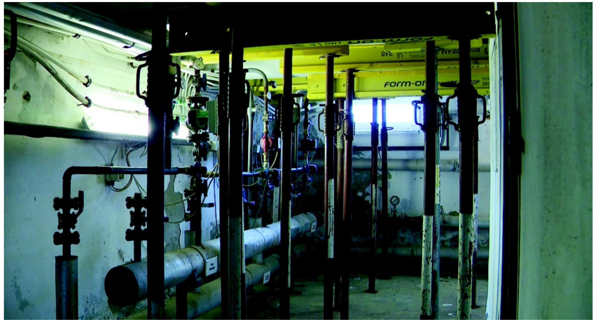
Avatlan szemmel is egyértelműen látható, hogy alátámasztás szükséges a stabilitáshoz

– A Sóstó-Gyógyfürdők Zrt.-nek saját forrása ilyen nagy volumenű felújításra nincsen. A banki finanszírozás a kamatköltségek és a – várhatóan – nem megtérülő beruházás miatt szintén nem merülhet fel. Társaságunk és Nyíregyháza MJV Önkormányzata azonban folyamatosan ke-