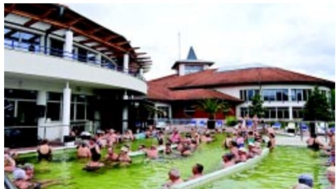
Az Aquarius élményfürdőben elérhetőek a kedvelt szolgáltatások

tudjon, hiszen már akkortájt is 50 éves volt az épület. Másrészt az energetikai korszerűsítés hatása a mai napig hasznosul: a napelemek termelése a villamosenergia-felhasználásunkat csökkenti, a homlokzati hőszigetelés és nyílászárócsere az épület temperálásában nyújtanak segítséget, hiszen az épület fenntartása és őrzése folyamatos. Ezekhez az elemekhez egy későbbi (adott esetben teljes) felújítás sem kell már hozzányúlni. Hozzá tartozik az igazsághoz, hogy ezek a felújítások összességében meg sem közelítik azt a 2 milliárd forintot, amire most szükség lenne az újrainvitáshoz. A korábban rendel-