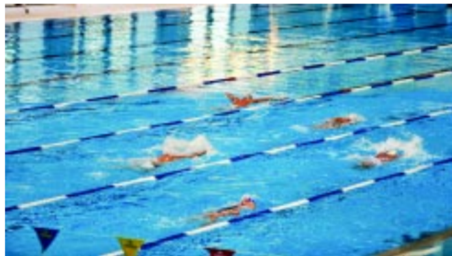
Az Eissmann városi uszoda tökéletes terepe a sportolásnak

– A fürdő újrainvitását követően sem lenne könnyű feladat az üzemeltetés. Ennek oka az, hogy bár sokaknak fájó a Júlia Fürdő hiánya és hiányzik nekik ez a létesítmény, de a vendégszám a bezárás előtti 10 év átlagában is mégiscsak roppant alacsony volt, ami nagyságrendileg 100 ezer vendéget jelentett évente. Ez első hallásra soknak tűnhet, de ha elosztjuk 365-tel, napi 273 vendégről beszélünk, beleértve az úszásra érkező gyerekeket is. Nagyon speciális adottságú fürdőtől eltekintve nincsen olyan fürdő az országban, ami egész éves nyitvatartással ilyen komplex szolgáltatásokat tudna nyújtani 100 ezer vendéggel rentábilisan. Ha a jegyárakat megdupláznánk a veszteség minimalizálása érdekében, akkor is 100 millió forint körüli veszteséggel kalkulálunk, hangsúlyozom, 100%-os emelkedés mellett. Ha „csak” az inflációnak megfelelő jegyár-