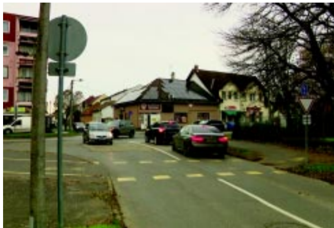
Szintén a térségben valósul meg jövőre a Városi Stadion mellett az év során lebontott garázsok helyén az új parkoló.