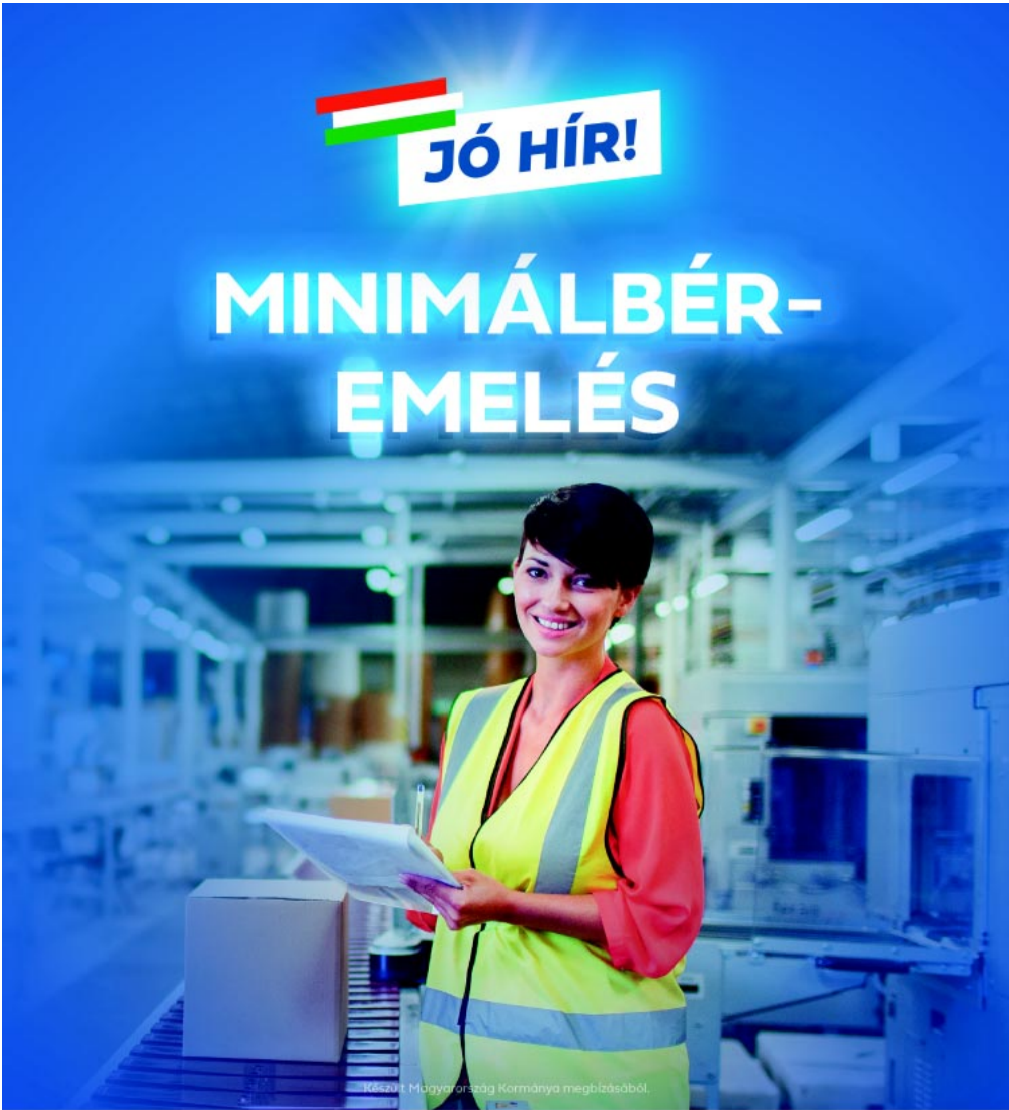
Készült Magyarország Kormánya megbízásából.