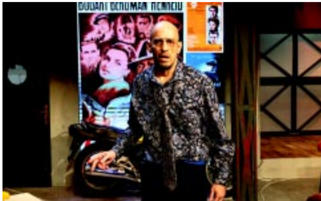
A Játszd újra, Sam! című darabban

– Többször beszélünk erről a darabban. Vélhetően, aki ezt műveli, máshogy éli meg, de én tényleg azt gondolom: nem más ő, mint egy darab hús, egy áru, egy termék. Úgy is kezelik. A mostani életem ismeretében azt mondom, nem szeretnék pénzért sem áru vagy termék lenni. Nyilván humor forrása is, hogy mi ott hatan, nem kigyúrt adoniszok táncolunk és vetkőzünk. Szerepünk szerint azért vállaljuk be az alul semmit , mert „sima” chippendale-ként nem élnénk meg. Lapot húzunk a 19-re... Hasonló sorsra, munkanélkülivé válásra ki-ki ismer eseteket a környezetében. Az a kérdés, hogy aki az életben ilyen nehéz helyzetbe kerül,