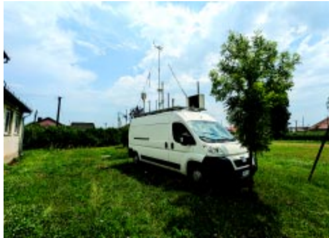
A levegőminőséget fix és mobil eszközökkel is ellenőrzik majd

A monitoring rendszer tervezésének alapját – a már felsorolt hatások figyelembevételével – az ipari parkban már jelen lévő cégek tevékenységeire visszavezethető légszennyező anyagok kibocsátásainak feltérképezése jelentette. Jelen esetben az önkormányzat célkitűzéseinek megfelelően a meglévő ipari kibocsátók mel-