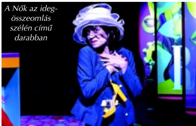
A Nők az ideg-összeomlás szélén című darabban

– Visszatérve a kiinduló kérdéshez: ki tudod választani a három legkedvesebb szerepedet?