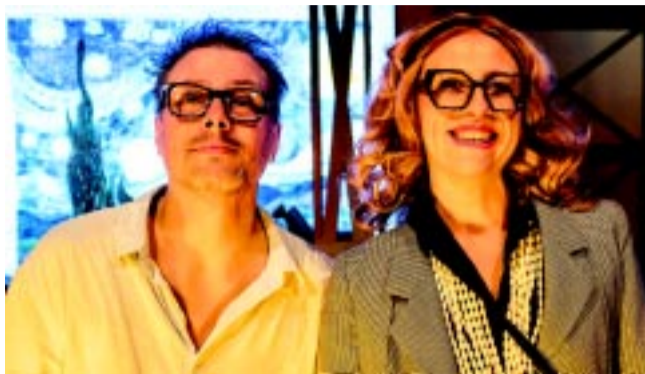
A Játssz újra, Sam! című darabban