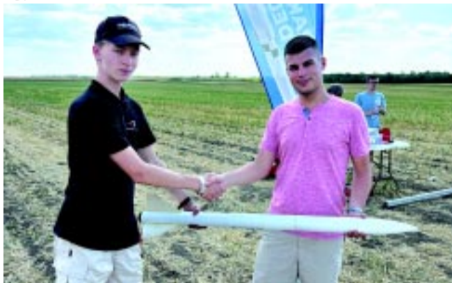
Csapatban a siker

Botond: – A bajai tábor egy hagyományosan megrendezett esemény, amit a Bajai Tudományos és Ismeretterjesztő Egyesület szervez. Az úrkutatást és a rakétamodelllezést