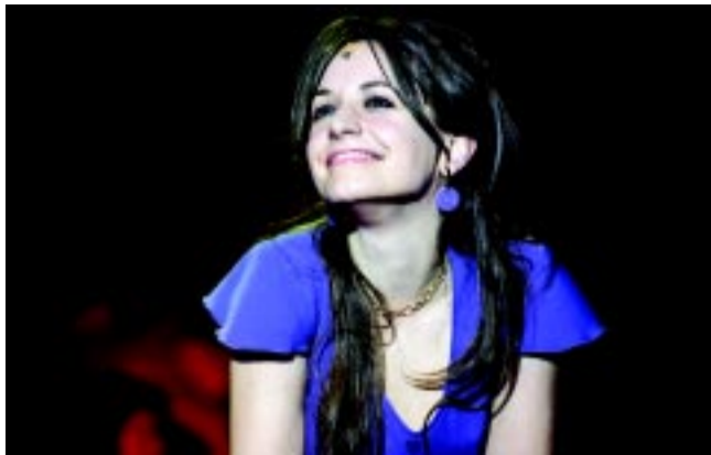
A Nők az idegösszeomlás szélén című előadásban