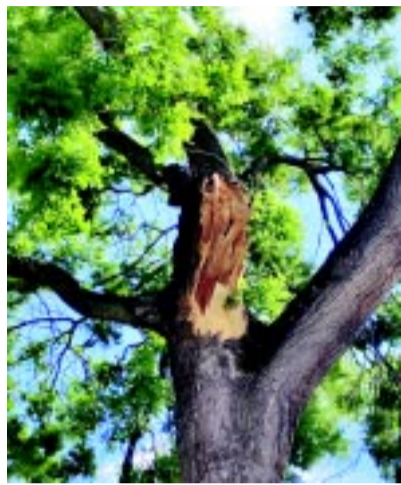
A Selyem utcai fa csak látszólag volt egészséges, súlyos sérülést szenvedett

De nézzünk egy-két konkrét, a közelmúltból származó példát! – A Dózsa György utcán a viharos időjárás következtében több ágletörés is történt a védett japánakácoról. Az ehhez kapcsolódó munkálatok közben a Faápoló Csoport tagjai több kiszáradt fát is tapasztaltak a Dózsa