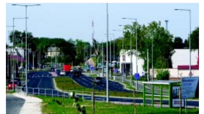
Négy évtized múltán lett kész a város belső környürije, a nagykerutát a hiányzó szakasz négy nyomúsításával

tudtuk zárni, amire Nyíregyháza polgárai négy évtizedet vártak, és kiemelt kérdés volt a Tiszavasvári úti felüljáró többlépcsős rekonstrukciója is. A Modern Városok Programjában szereplő beruházások is erősíteni tudták a várost, beleértve a Nyíregyházi Állatpark új attrakcióját, a Jégvilágot, a már emlegetett stadiont, és a belvárosban kialakult Kulturális Negyedre is nagyon büszkék lehetünk. A lényeg, hogy döntően megvalósultak az eltervezett fejlesztéseink az elmúlt időszakban, mellyel ki tudjuk szolgálni a kultúra kedvelőit is.