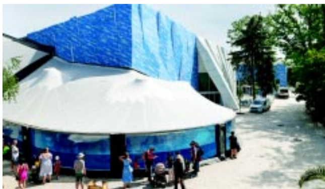
A Nyíregyházi Állatpark új attrakciója, a Jégvilág az egyik fontos fejlesztése volt a kormányzati Modern Városok Programnak

Nyíregyháza országgyűlési képviselőjét az önkormányzati választásról is kérdeztük, melynek eredményeként