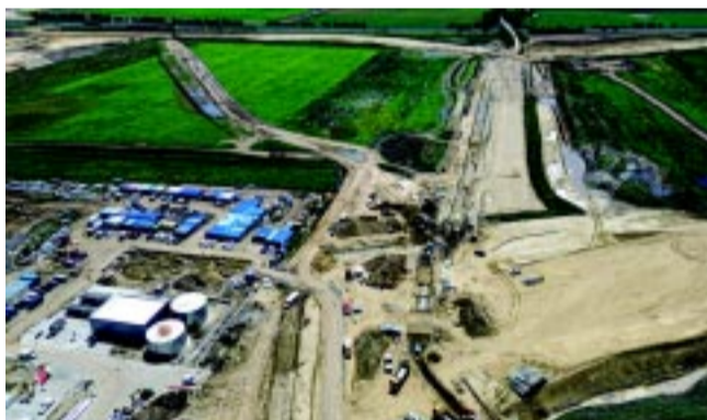
A Nyíregyházi Déli Ipari Park az egyik jelentős gazdasági centrummá válik a régióban – központi forrásokból

A kormánybiztosnak azt a kérdést is feltettük, mi volt az elmúlt időszak számára legmeghatározóbb városi fejlesztése? – Nagyon fontos volt, hogy a nagykerutát be