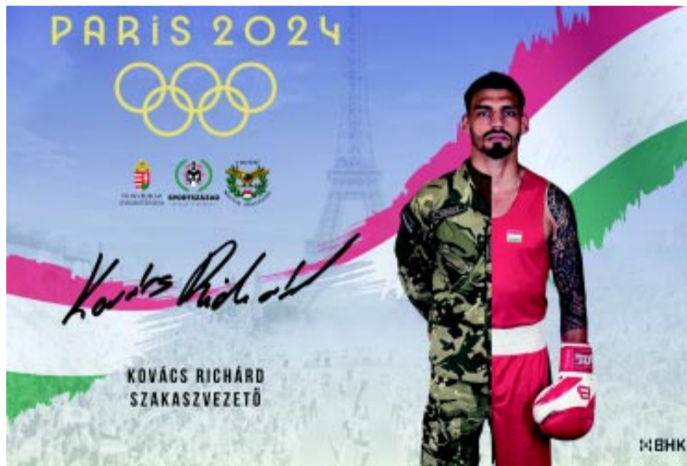
Olimpikon és katona is

tést, drága felszerelést. Szorgalmasnak, kitartónak és alázatosnak kell lenni, és akkor biztosan meglesz az eredménye. Már van is egy kissrác, akit le tudunk igazolni az egyesülethez. Más településekről is nagyon sok megkeresést kapok, és mindig szívesen segítek. Encsről például egy család keresett meg azzal, hogy kisfiuk régóta követi a pályafutásomat, nagyon szereti az ökölvívást, csak nincs lehetősége gyakorolni. Megleptem őt egy ajándék bokszesztyűvel és egy pár kesztyűvel, nagyon örült a segítségemnek. Tudom, hogy ha nincs motiváció és lehetőség, akkor nehéz kitörni.