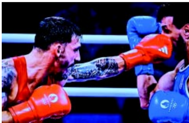
Pillanatkép az olimpiáról, a tévéközvetítésből

– Egészen fiatalon, 6-7 éves koromban kezdtem el az ökölvívást a máriapócsi edzőteremben, majd 9 éves ko-