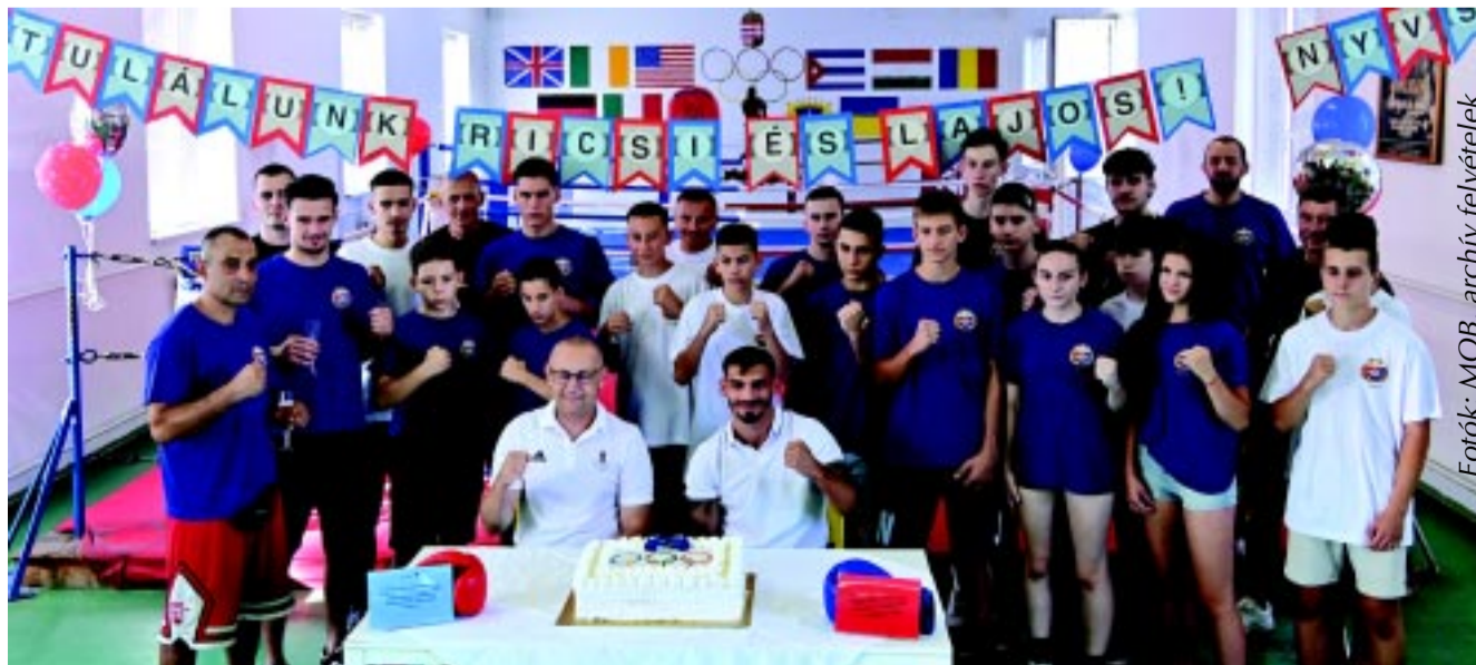
A sportegyesülete, az NYVSC ökölvívó szakosztálya is megünnepelte

– Az ökölvívás terén a profi karrieremet próbálom építeni. Ha lehetőségem lesz, akkor 2028-ban ismételen ott szeretnék lenni az olimpián Los Angelesben. A honvédségnél az alapkiképzésem most fog kezdődni szeptember elején. Mindenképpen szeretném folytatni a tartalékos katonai szolgálatot és aktívan részt venni a Magyar Honvédség életében.