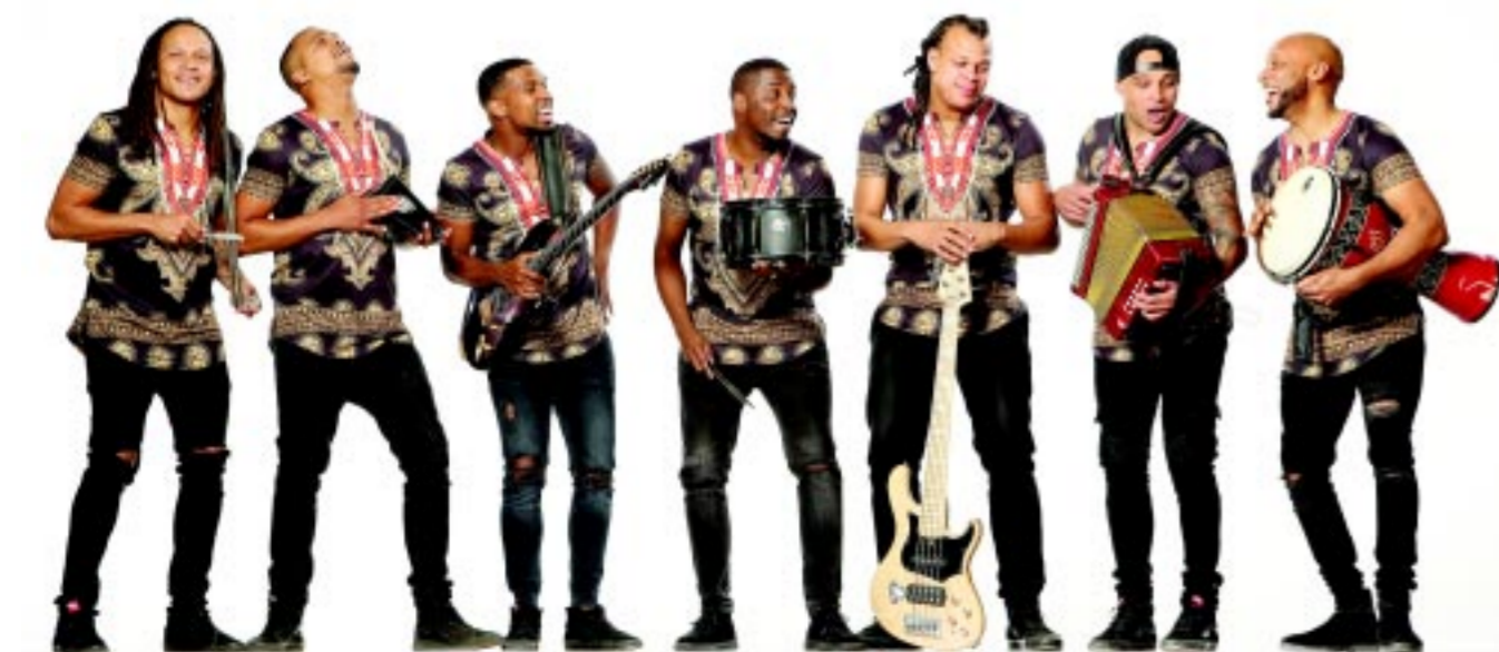
A Tabanka a Zöld-foki-szigetéről hoz majd világzenét

A nagy múltú VIDOR Fesztivál országsszerte komoly visszhanggal bír, a neves fellépők szívesen jönnek Nyíregyházára koncertezni, így a kilencnapos esemény a tér-