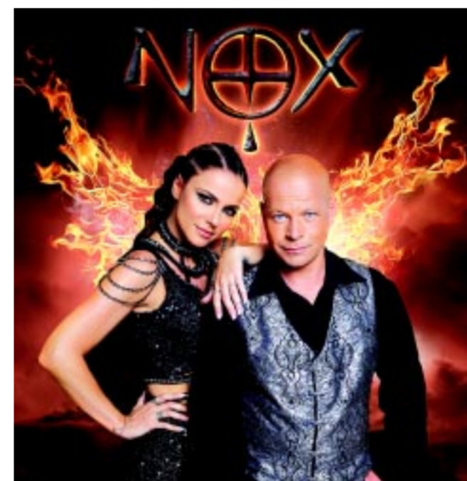
A NOX népszerűsége töretlen

A nemzetközi zenei szcéna szereplői közül itt lép fel a Moribaya, akik autentikus afrikai hangszereken adják elő dalaikat. A multikulturális együttes tagjai Lengyelországból,