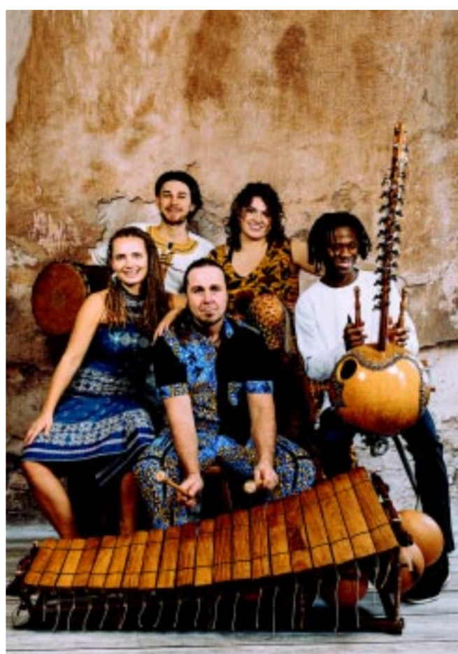
Autentikus afrikai hangszerekkel érkezik a Moribaya

A Kossuth téren idén is neves sztárfellépők látogatnak el, többek között a NOX, Geszti Péter, A Grund, a vígszínházi fiúzenekar, a Parno Graszt, Delhusa Gjon, a 4S Street, Dánielfy Gergő, valamint a Firkin kelta örömenjét is meghallgathatja a közönség. Augusztus 26-án, hétfőn este a Várudvari Nyári Színház és a Csiky Gergely Színház elő-