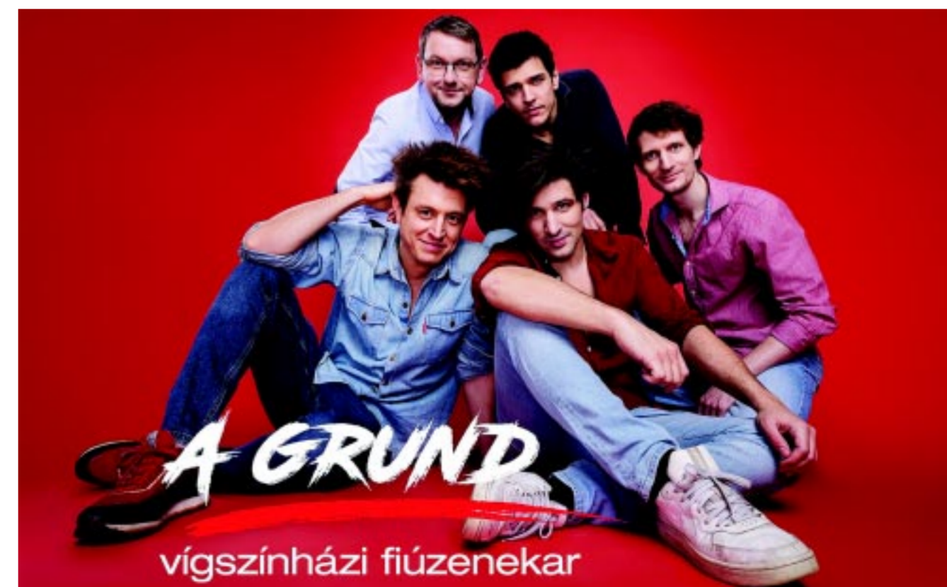
A GRUND szintén slágereket ígér