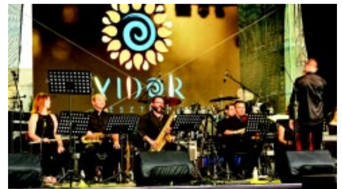
A VIDOR jelentős látogatottsággal bír, ami szintén hozzájárul a város turisztikai sikeréhez

– A turizmust is segíti, hogy indulnak a nyár végi programok, amelyek természetesen nagyon népszerűek a nyíregyháziak körében is, többségük már visszajön szabadságról, talán a programok miatt is. Augusztus közepén kezdődött a Cantemus Kórusfesztivál, nagyon sok helyről, Európán kívülről is komoly kórusok érkeznek. Ez is viszi a híret városunknak! Szintén hozzátartozik a nyár végéhez a kerékpáros világkupa, ahol az ifjúsági korosztály legjobbjai lesznek vendégeink, már 5. alkalommal. A futófesztiválunk szintén hagyományos, ez a negyedik, melynek újra a VIDOR Fesztivál kínálatában van a helye. A Vidámság és Derű Országos Seregszemléjének 9 napja