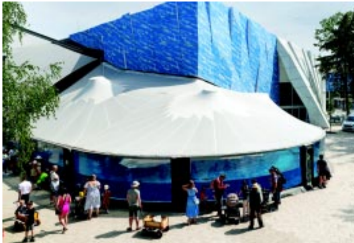
Sóstógyógyfürdő az elmúlt időszakban a legnépszerűbb helyek között szerepelt, köszönhetően olyan turisztikai attrakciónak, mint a Jégvilág Interaktív Állatbemutató

– Kicsit előre tekintve: a TOP Plusz az a következő nagy EU-s pályázat, amiből Nyíregyháza a megyei jogú városok között a legnagyobb keretet, 53 és fél milliárdot kap dedikált forrásként. Annak jelentős részét, több mint 10 milliárd forintot a közúti infrastruktúra fejlesztésére szánunk. Remélem, a tervezési munkák már az idén elindulhatnak. Van egy másik csomag, ami egy korábbi ciklusra mutat vissza, amikor az intézményfelújítások – az óvodák, bölcsődék, iskolák, szociális intézmények – voltak fókuszban. Annak