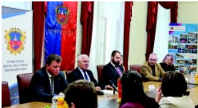
A Kassával közös Interreg program középpontjában a csapadékvíz-elvezetés áll

– Még egy jó példa a stratégiai gondolkodásra és a partnerségre a Kassával közös Interreg programunk, melynek központjában a csapadékvíz-elvezetés áll. Az elmúlt két évben nem érkeztek az országba EU források, de a közvetlen brüsszeli források és az interregionális pályázatok működtek, és mi ezt nagyon jól kihasználtuk. Felépítettünk egy szervezetet, ami jelentős eredményeket hozott már eddig is. A Talent Magnet projektünk például