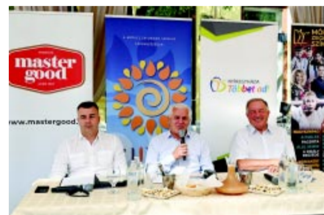
A sajtótájékoztató résztvevői

A vidámság és a derű mindenkié, a VIDOR eredeti célkitűzése továbbra sem változik, a programok döntő százaléka ingyenesen látogatható – ami ezúttal is nagyban köszönhető a városi, önkormányzati és a kormányzati forrásoknak, valamint a helyi vállalkozóknak. A főszponzor szerint kultúrát