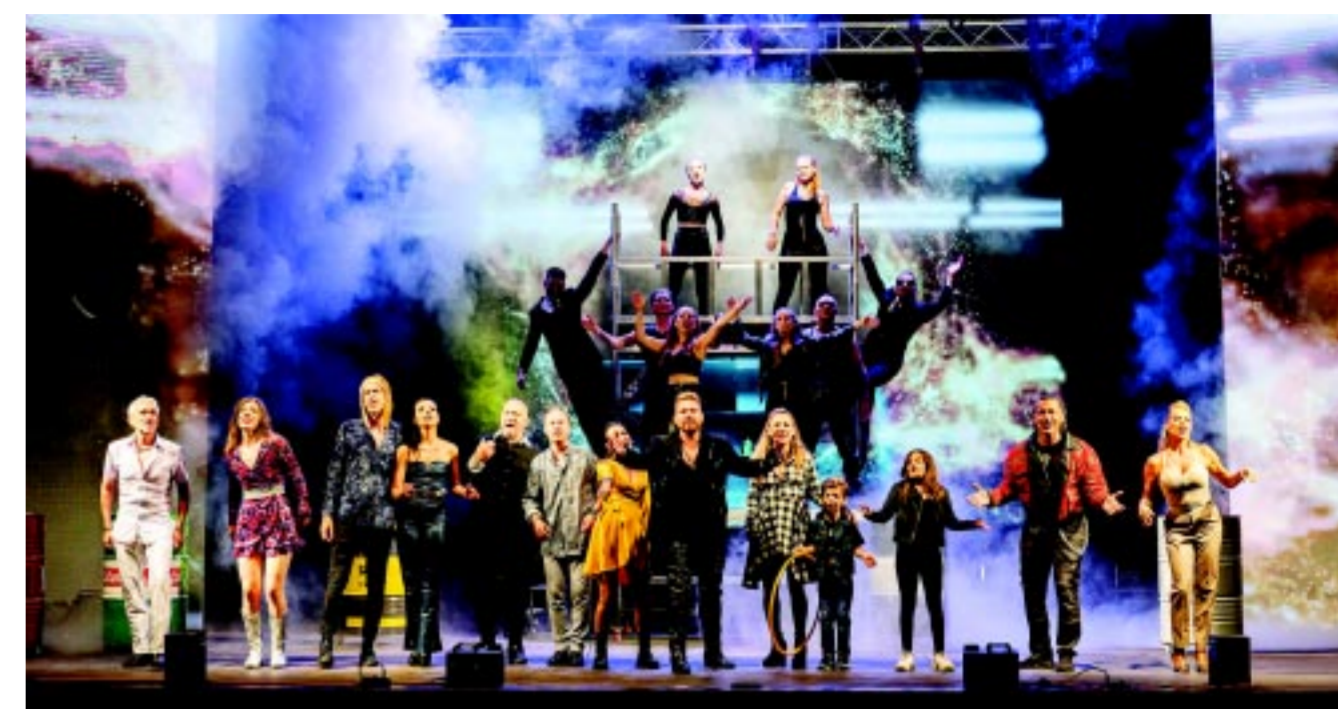
A Kör, az Edda musical is az ingyenes programsorozat része lesz Nyíregyházán