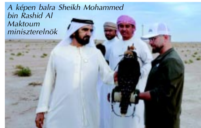
A képen balra Sheikh Mohammed bin Rashid Al Maktoum miniszterelnök

– Mindig kétféle életem volt. Magyarországon nem töltünk annyi időt, hogy az legyen a családunk székelye. A legkedvesebb barátaim azonban ott vannak, és a szívemet mindig dobogtatja az Alföld, vagy a Bükk. Én ott vagyok boldog, ahová a munkám szólít és ahol a családom van. Nyugdíjas éveimben oda akarok menni, ahol nyíltszívű és rendes emberek vannak. Ha később úgy döntünk, hogy Magyarországon telepedünk le, akkor Nyíregyháza környékét választom, ez nem kérdés.