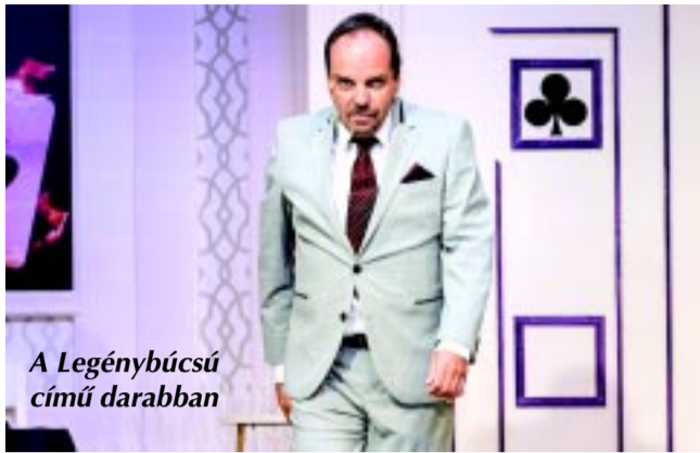
A Legénybúcsú című darabban

– A Bolha a fülbe speciális számomra, mert bár három felvonásos, én sem az elsőben, sem a harmadikban nem lépek színre, csupán a második elején-közepén és a legeslegvégén egy picit. Tehát két felvonásban nincs jelene-