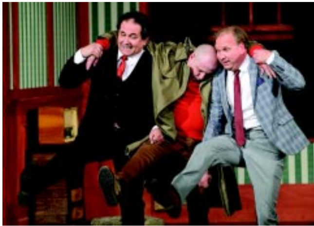
A miniszter félrelép című előadás egyik jelenete