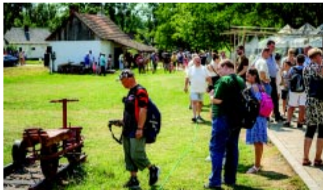
A kézi hajtálynak is nagy sikere volt

– Ez már a 74. Juliális és a 2. olyan, amikor a MÁV-os és a volános dolgozók közösen ünnepelnek. A kollégáink egész évben, éjjel-nappal szolgáltatnak, szállítják az utasokat, és olyan helyzetekben is ellátják a szolgálatukat, ami sokak számára elképzelhetetlen. Nincs olyan, hogy