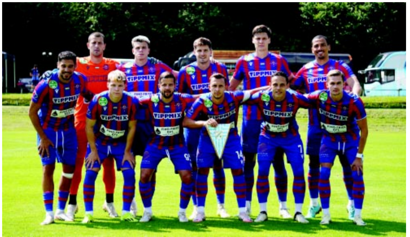
Most már az NB I-ben készülhetnek hasonló képek