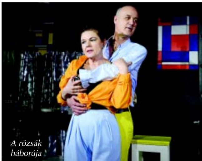
A rózsák háborúja