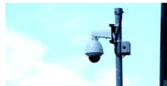
22 újabb térfigyelő kamera vigyázza majd a biztonságot városrészre

– Nálunk a költségvetés előkészítése folyamatos. De nem is a költségvetésre koncentrálnak, hanem a megoldandó feladatokra. Az ütemezésnél az a kérdés, hogy melyik költségvetési évben, milyen finanszírozással valósítható meg. Természetesen az első szempont a pályázati lehetőségek maximális kihasználtsága. Ebből a szempontból Nyíregyháza az elmúlt 10 évben nagyon nagy eredményeket ért