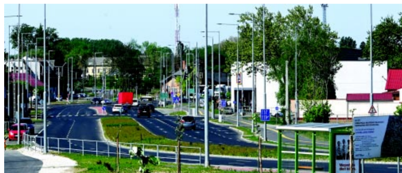
Tavalyi fejlesztés volt a nagykörút teljessége, de ez sem egy esztendőre korlátozódik, hiszen több évnyi előkészítő munka kellett hozzá

– A költségvetést minden évben január–februárban fogadjuk el, ezt egy 2–3 hónapos időszak követi, amikor a közbeszerzési eljárásokat kell lefolytatni, így leghamarabb áprilistól indulhatnak el a beruházások. Ahogy azonban az előbbieken is említettem, egy-egy ilyen projekt mögött egy év, vagy akár több is van. Az idén is dolgozunk olyan fejlesztések elkészítésén, amik lehet, hogy jövőre, vagy akár csak 2026-ban fognak elindulni.