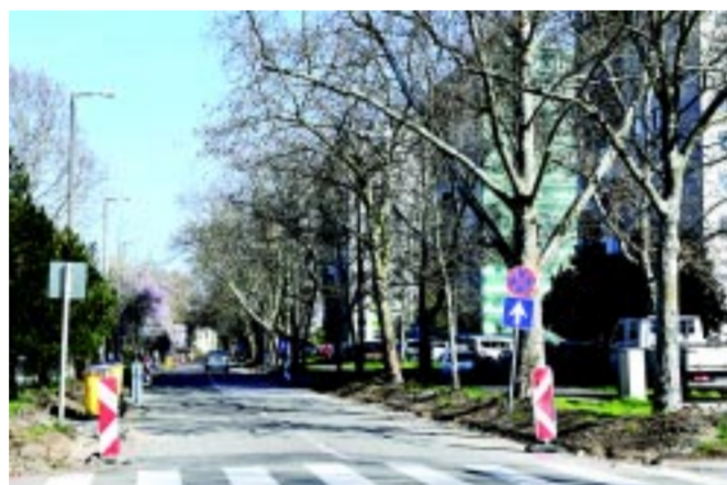
Már javában zajlik az idén 25 helyszínt érintő útfelújítási program

– Milyen hosszú tervezési időszak előzi meg egy-egy beruházás elindítását?