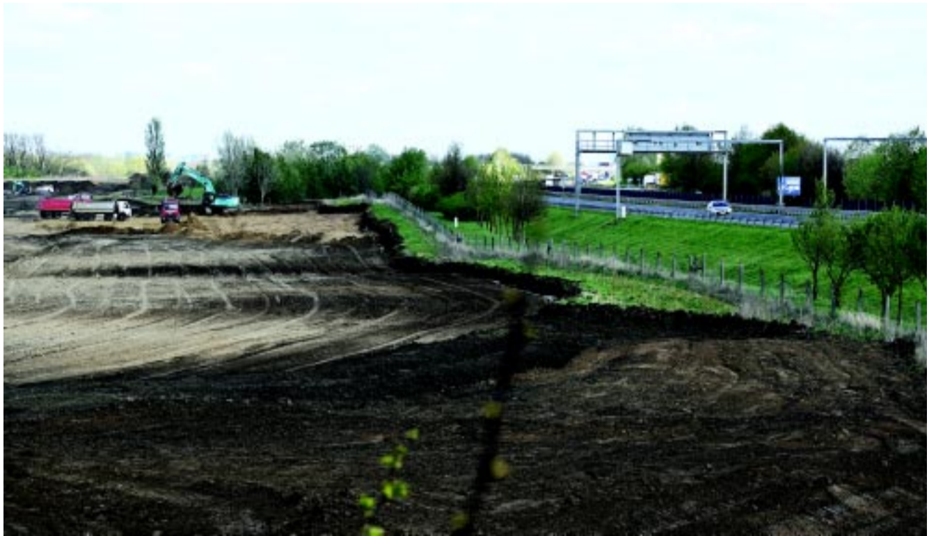
A Nyíregyházi Déli Ipari Park nagy volumenű fejlesztésének a közművek kiépítése is a részét képezi, köztük a szennyvízelvezetés