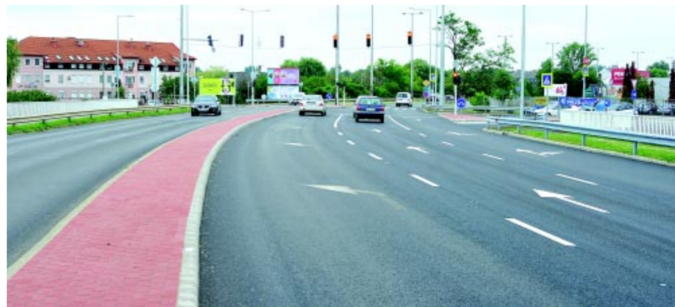
A László u.–Belső körúti új, jelzőlámpás csomópont projektje is hosszú folyamat volt, a tervezéstől a pályázatig, mint a többi hasonló

– A jelenleg szemmel látható fejlesztések jelentős része tavasszal befejeződik. Vannak olyan beruházások,