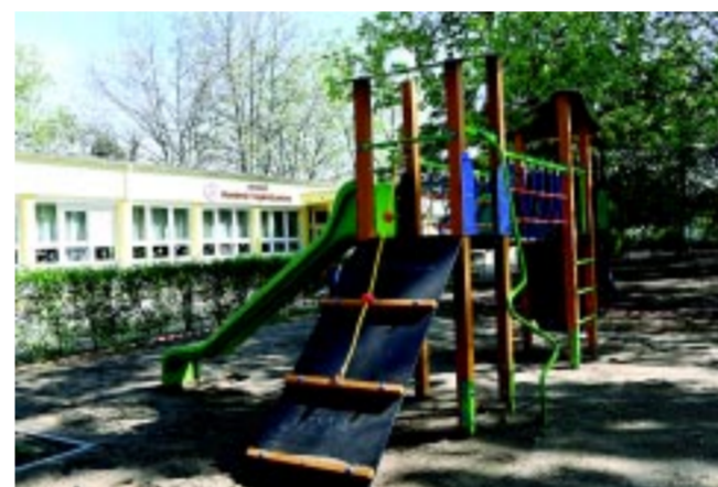
Nyolc óvoda udvarrészre újul meg 2024 első felében

az iskolakezdesre, óvodaindulásra, amikor a legnagyobb a forgalom, be is fejeződjenek a beruházások. Vagy ha nem befejezhető, olyan stádiumba jusson, ami minimálisan