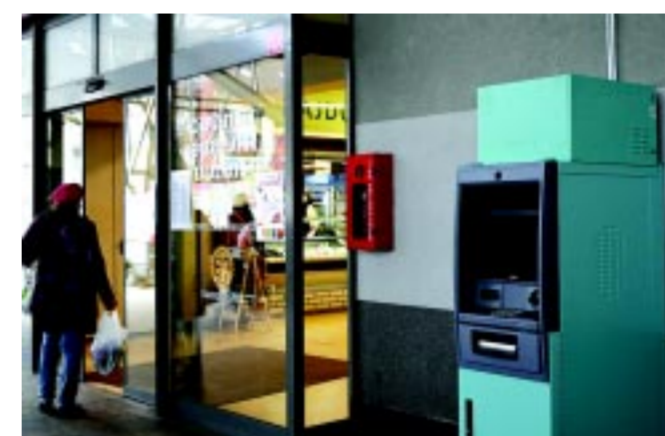
Új bankautomaták is segítik a kényelmes pénzfelvételt

el. A beruházásainak túlnyomó többségét, 100 százalékos pályázati finanszírozásból tudtuk megvalósítani. Természetesen vannak olyan esetek, amikor a saját pénzünkkel fedeztünk be előre. Ilyen volt például az 5 milliárdos útfelújítás esetében is, amelynek gyakorlatilag 100 milliós nagyságrendben, saját erőből finanszíroztuk a beruházások előkészítését. Az év végi maradványunkat – mert szigorúan gazdálkodtunk és gazdálkodunk – két részre bontottunk: egyrészt a gyerekekre (bölcsődék, óvodák felújítására és építésére) költöttünk, másrészt az út- és járdafelújításokra.