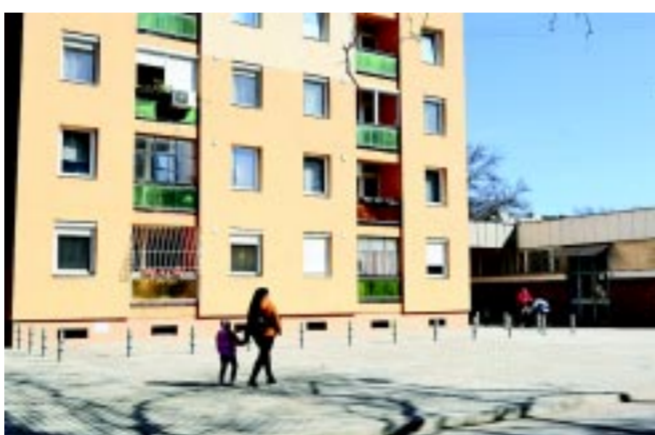
29 ponton történik 2024-ben járdafelújítás

– Általában egyszerre foglalkozunk minden kérdéssel, azonban higgadtan, nem kapkodva, sokkal inkább jól átgondolva. Mindig javaslatokat kérek a képviselőinktől, a polgármesteri hivatal illetékes osztályaitól, valamint a NYÍRVV Nonprofit Kft.-től határidők megjelölésével együtt, beszámolva, hogy mit tennének az első, a második, vagy a harmadik helyre. Ezekhez szempontokat adok nekik. Mi az, ami a legrovidebb idő alatt a legkevesebb pénzből megoldható és minél több embert érint? Mi az, ami S. O. S., és azonnal meg kell oldani? Mi az, ami régóta húzódik, sok embert érint, de nem kezelhető egy év alatt? Az elmúlt 14 év alatt meg nem tudom mondani, hányszor jártam be a várost, és néztem meg a lehetséges helyszíneket. Miután