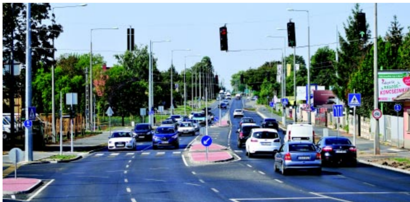
A Tiszavasvári úti felüljáró rekonstrukciója egy több fázisból álló folyamat részeként valósult meg, különböző forrásokból