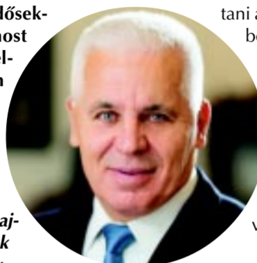
Dr. Kovács Ferenc polgármester

Az egymásra épülő beruházások összefüggéseit bemutató sorozat keretében – a dr. Kovács Ferenc polgármesterrel készült interjúk során – írtunk a turizusról, a bújtos, a sóstói és a belvárosi fejlesztésekről, de beszélgettünk már a Zöld Város Programról, a sportinfrastruktúrát érintő változásokról, valamint a városban megvalósuló rendezvényekről és az időknek szóló támogatásokról is. A fókusz most az idei évre helyeződik: a beruházások, felújítások 2024-ben is folytatódnak, nem előzmények nélkül.