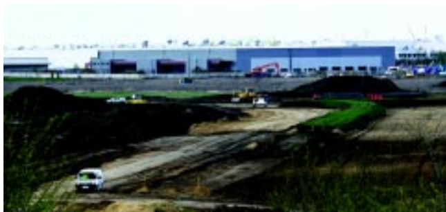
A Hungary Sunwoda Kft. az első környezetvédelmi engedélykérelem benyújtását követően elindította talajelőkészítő munkálatait, miközben vállalja a szigorú környezetvédelmi előírások betartását

– Nagy fordulópont van nemcsak Magyarország és Nyíregyháza vonatkozásában, az egész világgazdaságban megjelent egy nagy technológiai váltás, mely során sajnos cégek fognak megszűnni, lásd az Electrolux minket is érintő példáját. Jól érzékelteti a világtrendet, hogy a német Boysen, amely huszonhat egységében kipufogókat gyártott, ezt pár év múlva nem fogja tudni folytatni, hiszen az elektromos