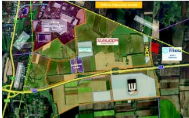
A 640 hektáros ipari park bővítési terület szerves egységet alkot a már meglévő, majdnem 130 hektáros, telített Nyíregyházi Ipari Parkkal

A tudatos tervezés sikerét mutatja, hogy már több beruházó is érkezett a területre. A dél-koreai W-Scope Hungary Plant Kft. szeparátorfilmgyár jól halad első üteme kivitelezésével, részben már a gépek telepítése zajlik. Próbaüzemüket 2024. második félévében tervezik megkezdeni. A német Boysen Group a debreceni BMW beszállítójaként fog acélházakat készíteni. A Hungary Sunwoda Kft. akkumulátorgyár jelenleg régészeti feltárásokat és kapcsolódó előkészítő munkálatokat végez a területen – ezen vállalatok tevékenysége mind az elektromobilitáshoz, valamint a zöldátálláshoz kapcsolódik. Az MCE Nyíregyháza Kft. a beru-