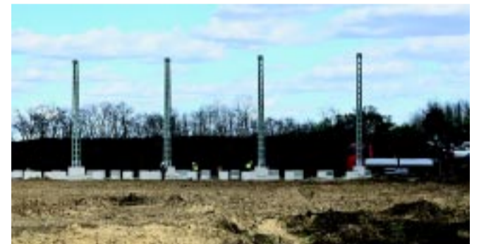
Az OPUS TITÁSZ már kiépítette a szükséges földkábel területen. Jelenleg az állomás építése zajlik.

Az OPUS TITÁSZ mint szerződéses partner már kiépítette a szükséges földkábel, az OPUS TIGÁZ több mint 9 km gázvezetékét fektet le. Az iparpark-fejlesztés II. és III. ütemeinek tervezése folyamatban van. A II. ütem tervezésének szállítása várhatóan 2024. negyedik negyedévében, a III. ütemé várhatóan 2025. harmadik negyedévében történik meg. A 640 hektáros terület, mely kapcsolódik a 130 hektáros, már betelt ipari parkhoz, jelentős be-