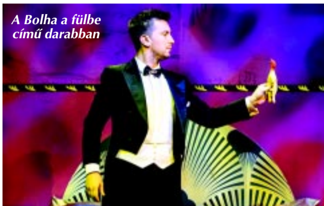
A Bolha a fülbe című darabban

– A vívójelenet nagyon látványos: kívülről veszélyesnek, s persze élethűnek látszik. Sokat gyakoroltatok?