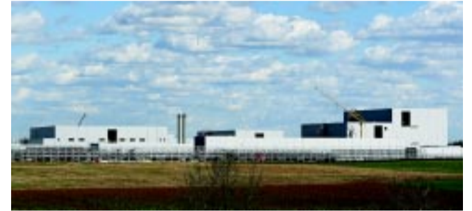
A W-Scope Hungary Plant Kft. szeparátorfilmgyár hamarosan a gépeket telepíti új gyárában. A város fejlődésének új lendületet adó beruházó, amely az elektromos autókhoz elengedhetetlen alkatrészeket fog gyártani.

az első részhatáridő már 2024. szeptember elejére tehető. Ezek tartalmazzák a környezetvédelmi monitoring rendszert is. – Megkezdődött február 13-án a 9 milliárdos földmunka, az infrastruktúra kiépítésének az első üteme – ezt nyíregyházi cég végzi. Rövidesen indítja az összesen 31 milliárdos első ütem nagyobb részének a kivitelezését a konzorcium. Ez tartalmaz például 14 km belső úthálózatot, 10 km kerékpárút-hálózatot, közvilágítást, a víz, szennyvíz, gáz, villanyáram, csapadékvíz-elvezetés infrastruktúráját, tehát a közműhálózat teljes kiépítését, és országos közúthálózati kapcsolatok létesítését – tette hozzá.