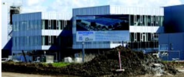
A Boysen Group az autóiipari zöldátállás jegyében acélházakat fog gyártani. A beruházás nemcsak munkahelyeket teremt, de környezetvédelmi szempontból is a prémium kategóriába tartozik, kiemelve a legmodernebb energetikai technológiák alkalmazását.

házás előkészítésénél tart. A Quantum svéd elektromos hőszivattyúkat gyártó vállalat az Electrolux létesítményét