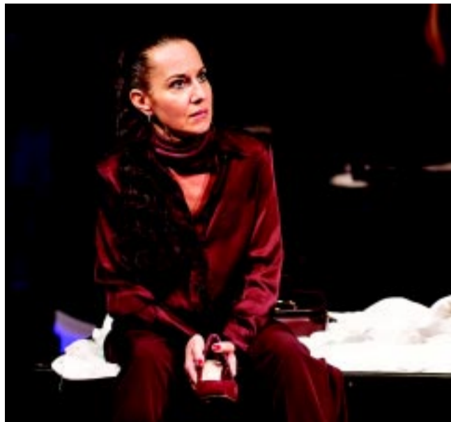
A Házassági leckék középhaszadók című előadásban

– A kényszer nagy úr, de – visszatérve az előadáshoz – tényleg elkerülhetetlen, mondhatni, szükségszerű a pénzkérés ilyen formája?