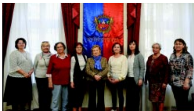
Az Idősügyi Tanács 12 éve segíti javaslatokkal, ötletekkel, problémafelvetésekkel az önkormányzat munkáját

Már 12 éves az Idősügyi Tanács – Az ázsiai befektetőkkel történő tárgyalások során mindig azt tapasztaltam, hogy számukra mennyire fontos az idősek tisztelete, és ezt teljesen természetesnek is veszik. Örülök, hogy ma már ez Nyíregyházán is így van. Az ön-