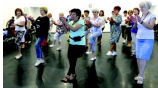
A Senior örömtánc a Mozdulj Nyíregyháza! részeként igazi testi-szellemi felüdülést jelent

– A szellemi egészség mellett azonban legalább annyira, vagy még fontosabb a megfelelő fizikai kondíció is. Mindig meglepődéssel figyelem a senior örömtánc egy-egy foglalkozásának képeit, hiszen az órákon megtelik a VMKK