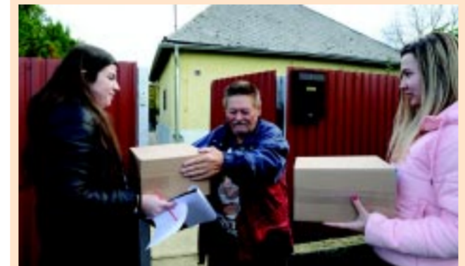
A karácsonyi ajándécsomag 2013 óta eljut a nyíregyházi nyugdíjasokhoz

– Az önkormányzat minden évben karácsonyi ajándécsomaggal is kedveskedik a városban élő nyugdíjasoknak. Ennek értéke 2023-ban az azt megelőző évihez képest emelkedett 3000-ról bruttó 4000 Ft-ra, és ez a jut-