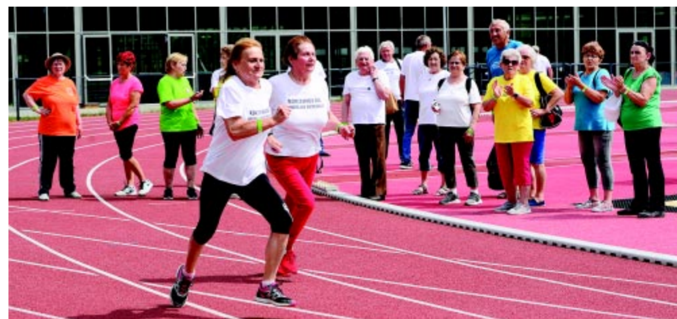
A Szépkorúak Sporttalálkozójának helyszíne most már a Közép-Európában egyedülálló Atlétikai Centrum

terme, de azt a pillanatot is nehéz elfelejteni, amikor tavaly több mint ötszázan vonultak fel a Szépkorúak Sporttalálkozója az Atlétikai Centrumban. Nyíregyháza sportos város, és ez ma már igaz minden korosztályra. A Mozdulj Nyíregyháza! órarendjének összeállításakor mindig arra törekedünk, hogy valamennyi korosztály, így az időskorúak számára is rendszeres sportolási lehetőség biztosítsunk. Heti beosztás szerint minden nap meghatározott sportprogram (joga, gerinctorna, esés megelőzés program, kontrasztos mozgásprogram, senior tánc, senior vízi torna, senior örömtánc, tartásjavító torna stb.) fogadja őket.