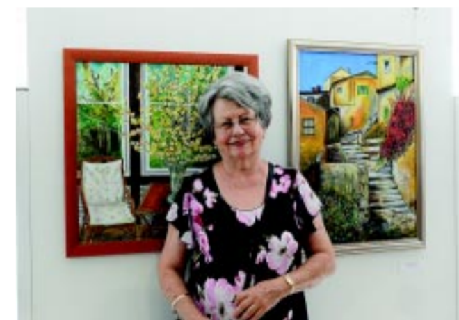
Az Alkotó Idősek kiállítása mindig sok pályázatot vonz

– A legfontosabbnak azt tartom, hogy legyen jelen az értékrendünkben és a mindennapjainkban is az idősek szí-