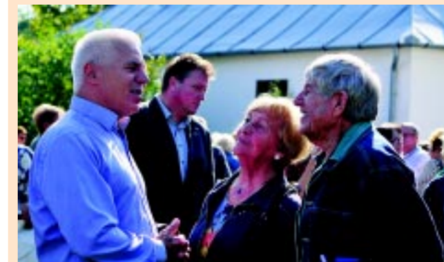
Az Idősek Világnapjának helyszíne az állatparki séták után ezúttal egy másik turisztikai attrakció, a Sóstói Múzeumfaluba volt

– Tavaly az Idősek Világnapi rendezvényt a Sóstói Múzeumfaluban rendezte meg az Önkormányzat az