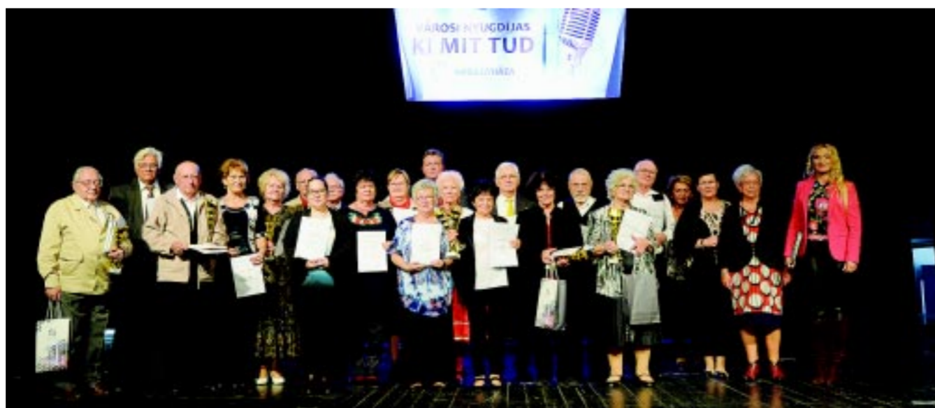
A nyugdíjas „Ki mit tud?” mindig színvonalas produkciókat vonultat fel

Nyíregyháza legutóbb 2016-ban nyerte el az Idősbarát Önkormányzat díjat. Ezt még 2004-ben alapította a minisztérium azzal a céllal, hogy felhívják a figyelmet: a településeken az önkormányzatok tehetnek a legtöbbet a szépkorúakért. Az elismerést pályázat útján azok az önkormányzatok nyerhetik el, amelyek a szociális gondoskodás körébe tartozó kötelező idősügyi alapfeladataikat teljesítik, tevékenységükkel elősegítik az időskorúak helyi szervezeteinek működését, hozzájárulnak szabadidős programjaik megszervezéséhez, együttműködést alakítanak ki a civil szervezetekkel, valamint többek között a helyi közéletbe is bevonják őket.