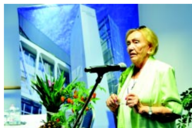
A Szépkorúak Akadémiája az egyik ismeretterjesztő szolgáltató, időseknek szóló programsorozat

– Szeretnénk, hogy az időskorúak élete még színesebb legyen városunkban és ehhez ma már több területen is lehetőséget biztosítunk számunkra. Csak néhányat kiemelve: Alzheimer Cafe, valamint Idősek Akadémiája működik a Szociális Gondozási és Egészségügyi Alapellátási Központ, vala-