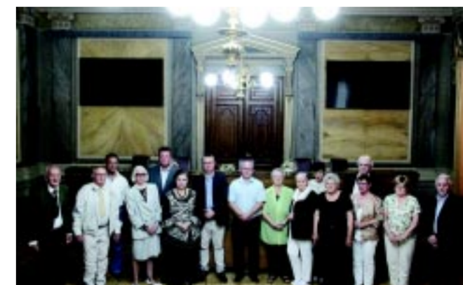
A „Meséld el nekem” pályázat eredménye már három kötetnyi visszaemlékezés, mely a város múltja szempontjából is érdekes munka

telete, hiszen – remélhetőleg – egyszer mindenki belép abba a korba. Ezért is fontos, hogy bánjunk úgy ezzel a generációval, ahogy mi szeretnénk, hogy majd bánjanak velünk, ha elérjük azt a kort. Nyíregyházán erre mindig szép példát látni és örömet, hogy a város nyugdíjasai aktív tagjai társadalmunknak. Amikor gyerek voltam, a szüleim sokat dolgoztak és olyankor a nagyszüleim vigyáztak rám, akiktől nagyon sokat tanultam. Ezért is fontos, hogy a generációk együttműködése minél több területen megnyíl-