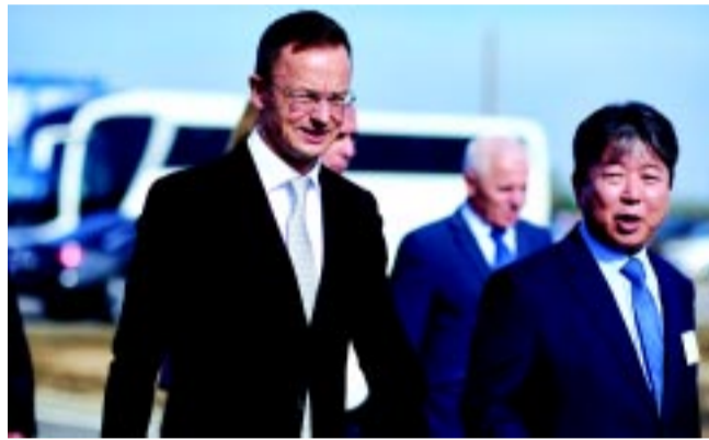
Szijjártó Péter a W-Scope ügyvezető igazgatójával

szág más európai országokhoz képest hamarabb kezdett el fókuszálni az elektromosautó-gyártók felé, és Magyarország volt az első ország, amellyel gazdasági együttműködés jöhetett létre az elektromosjármű-ipar fejlesztése irányában.