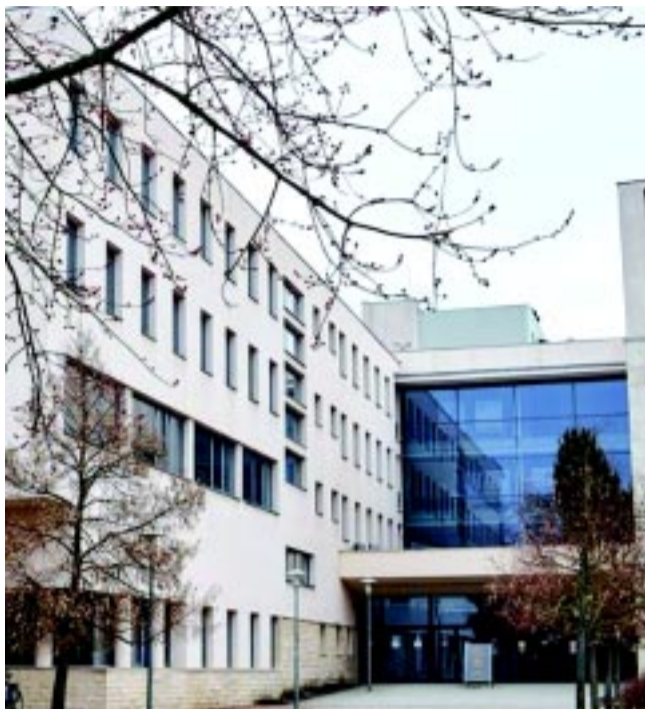
1958-ban nyílt a felsőfokú tanárképző intézet Nyíregyházán, majd 1962 szeptemberében indult a tanárképzés a Pedagógiai Főiskolán, mely '72-ben vette fel

– Ennek a régióknak korábban nem volt tanárképző intézménye, és az akkori oktatási kormányzat helyesen döntött úgy, hogy a régióban szükség van egy ilyenre. Ez volt a Tanárképző Főiskola, ami később Bessenyei György nevet vette fel, amely a Nyíregyházi Egyetem egyik jogelődjé. Ez azért fontos számunkra, mert intézményünknek mindmáig egyik legfontosabb profilja a tanárképzés. Számunkra az is fontos, hogy olyan tanárokat képezzünk, akik képesek jó színvonalon, modern módszertanokkal oktatni a fiatalokat mind Szabolcs-Szatmár-Bereg megyében, mind a távolabbi körzetekben.