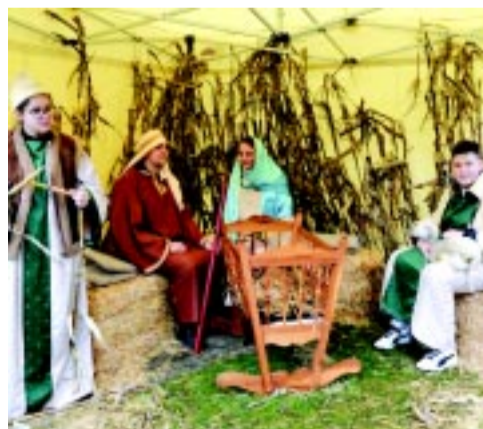
Élő betlehem is várta az érdeklődőket

A Jóságváros aktív közösségi életet él, idén többek között kapcsolódtak egy országos kezdeményezéshez, a világító adventi kalendáriumhoz. Így 24 napon keresztül, 24 ünnepi díszbe öltöztetett ablakkal várják a karácsonyt.