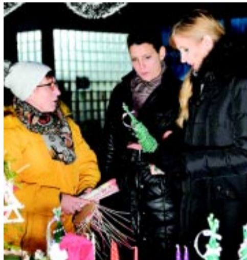
A képviselők a jóságvárosi adventen

– Mi itt, a Jóságvárosban nem tudnánk ilyen programokat szervezni, ha nem egy csapatban és nem egy közösségben dolgoznánk együtt. Békében és szeretetben tevékenykedünk, közösen.