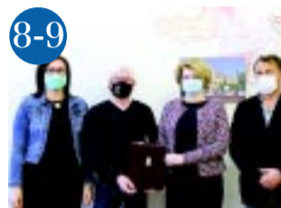
8-9 Karácsonyi adományok