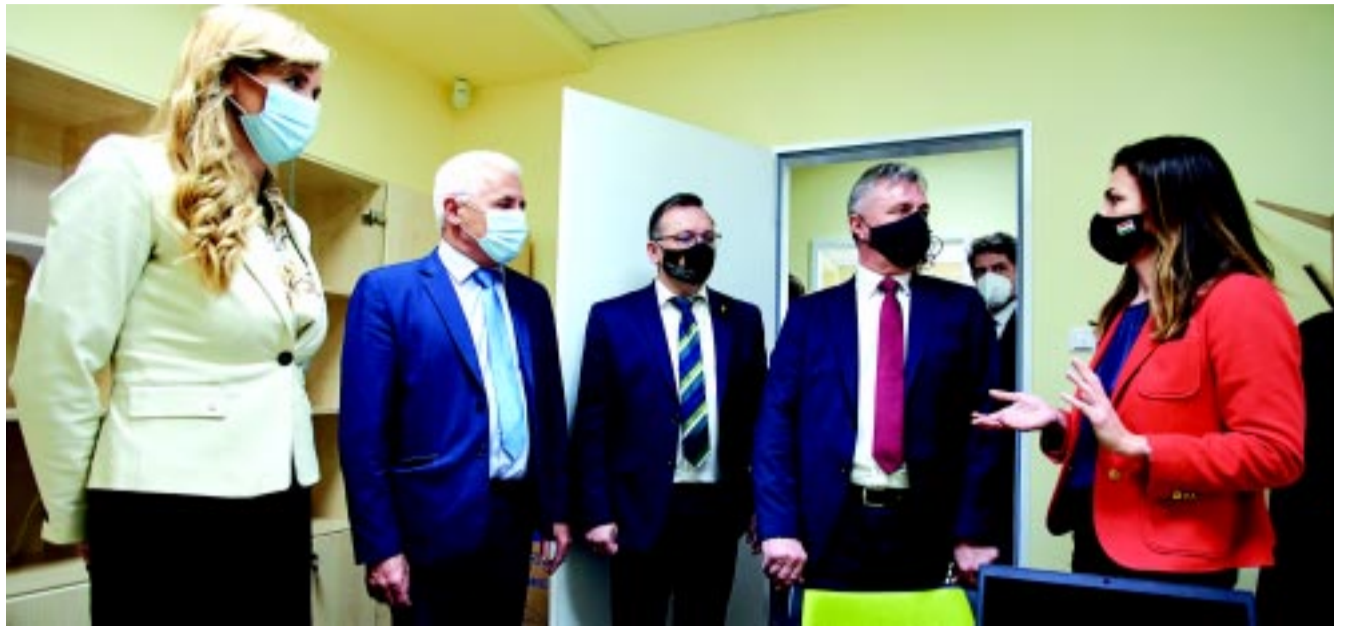
Dr. Szabó Tünde országgyűlési képviselő, dr. Kovács Ferenc polgármester, Román István kormány megbízott és dr. Vinnai Győző országgyűlési képviselő dr. Varga Judit miniszter társaságában

– Pedig ezt teszik, ezért fontos, hogy az állampolgárokat tájékoztassuk arról, hogy mi történik tulajdonképpen. A főtanácsnoki indítvány nem köti a bíróságot az ítéletében, ez csak egy vélemény, egy jogi álláspont. Meg kell várnunk az ítéletet, de azt mindenképpen fenntartjuk, hogy