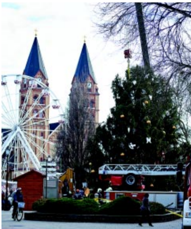
Kedden délben sikerült újra felállítani a város karácsonyfáját, miután azt vasárnap a viharos szél kitörte a helyéről

A Kossuth téren egészen december 31-ig még nyitva lesz a forgatag, továbbra is 18 faházban, mintegy 25 ajándékarus portékái között válogathatnak. A karácsonyi hangulatot megidéző ételek – kürtőskalács, lepények, sült hal, halászlé –, valamint italok – díjnyertes pálinkák, forralt borok várják a városlakókat. Mindemellett az Aranykapu