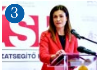
3 Miniszeri interjú

– Jelzésünkre a közlekedési hatóság is megvizsgálta a helyzetet, mielőtt engedélyt adott a beruházásokra. A helyszíni számlálás is megerősítette, amit érzékelünk, hogy az Árok utcai gyalogos szempontból is forgalmas csomópont, hiszen két iskola felé is vezet az új átkelő, de a Szabolcs utcai járókelőknek is fontos a fejlesztés. Miután a kivitelezők befejezték a munkát, városüzemeltető cégünk, a NYÍRVV gondoskodik a zöldfelület helyreállításáról is. Várhatóan még idén elkészülhet mindkettő, köszönjük a javaslatokat, használják egészséggel! – olvasható a bejegyzésben.