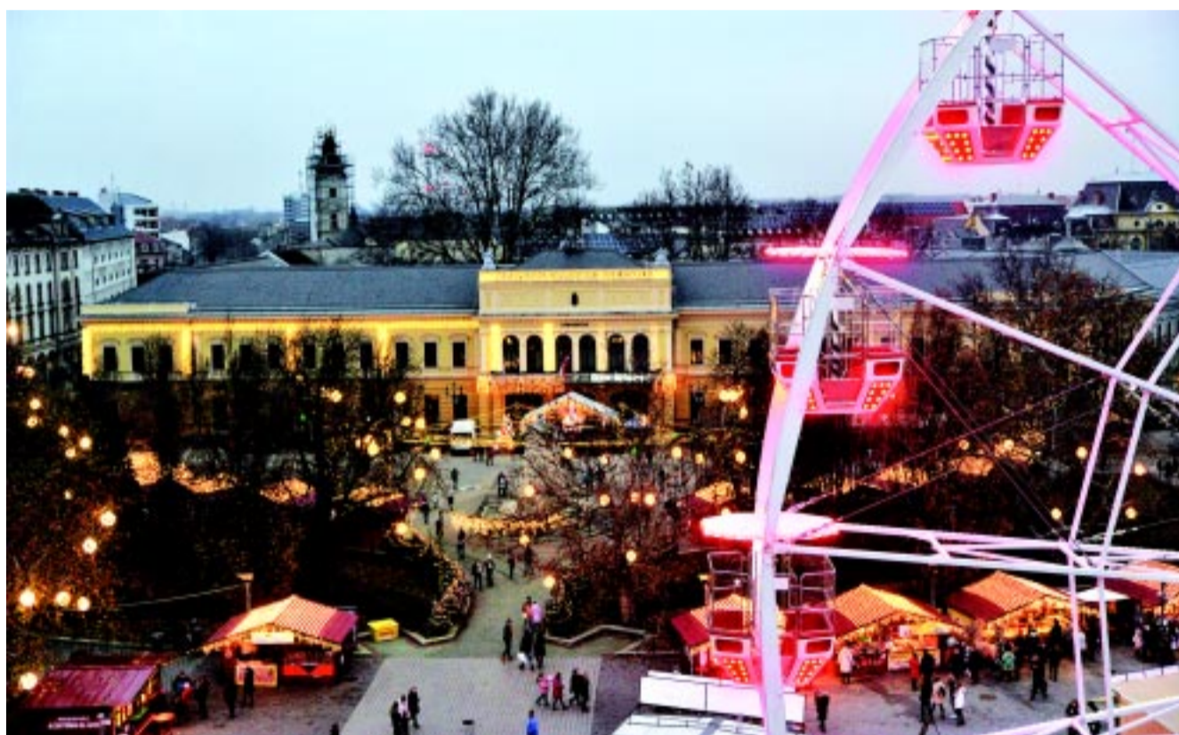
Ez a panoráma tárul azok elé, akik az adventi időszakban megmásszák a közel száz lépcsőfokot