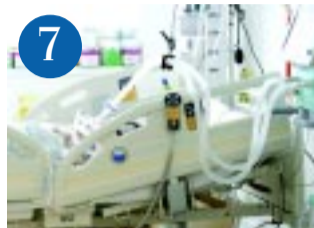
7 51 napig lélegeztetőn