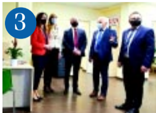
3 Áldozatsegítő Központ