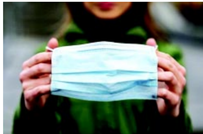
Országosan és helyileg is egyre több a koronavírus-világjárványhoz köthető szabályozás, ezek egyike a maszkviselés

A városnak biztató tárgyalásai vannak komoly befektetőkkel, most már terület is lesz az új beruházások számára, az ipari park két és félszeresére bővíthet – tette hozzá a polgármester. Az új területek közműkiépítésére kapta a kétfélmilliárd forintos támogatást az önkormányzat. Új munkahelyek teremtésével a fiatalok helyben tartását szeretnék biztosítani.