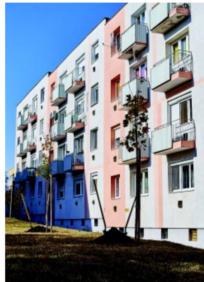
A polgármesteri fásítási program szintén elősegíti a környezetvédelmet

A környezetvédelem témaköre a napokban világszinten is téma volt, Áder János köztársasági elnök a klímacsúcsban arról beszélt, Magyarország vállalja, hogy 2050-re klímasemleges lesz, erről törvényt is született, a végrehajtás pedig megkezdődött, illetve 2030-ra beszünteti az ország a szénalapú áramtermelést.