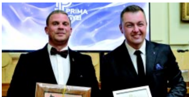
A Bürkös zenekar gálán jelenlévő tagjai

Magyar népművészet és közművelődés kategóriában a Bürkös Zenekar munkásságát ismerték el, akik 1998-ban