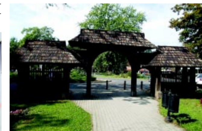
A sóstói Székelykaput is felújítaná az önkormányzat

A képviselők többek között megszavazták azt is, hogy felújítják a Székelykaput, ami évtizedek óta díszíti Sóstógyógyfürdőt. Erre pályázatot nyújtottak be a Telemi László Alapítvány által kiírt Népi Építészeti Program felhívására, a 17 millió forintos beruházás 80 százalékát támogatásból, illetve 20 százalék önerőből tudják majd felújítani.