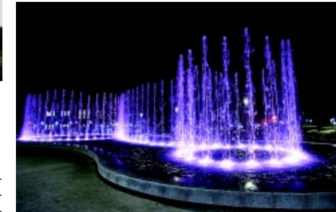
Az új, sóstógyógyfürdői látványosságot, az országsszerte egyedinek számító szökőkútrendszer környékét is térfigyelők pásztázzák majd, s a vasútállomáshoz is kerülnek újak