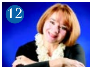
12 Pregitzer interjú