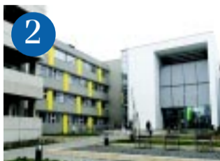
2 Látogatási tilalom