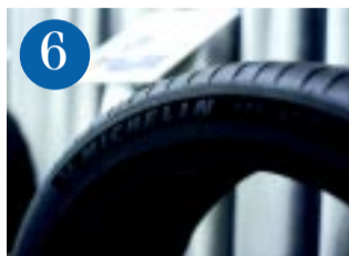
6 Michelin jubileum