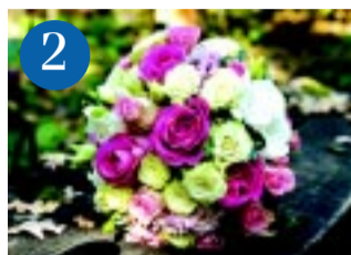
2 Házasságkötési akció