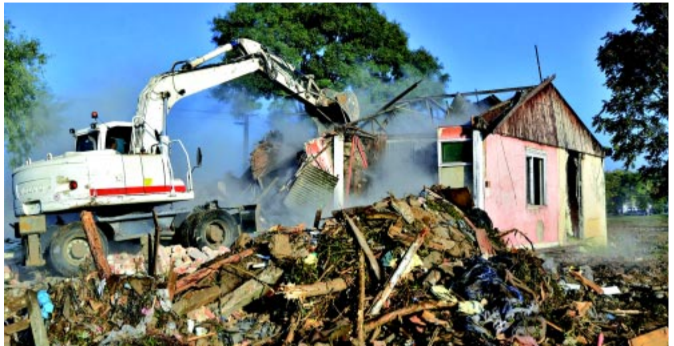
Megtörtént a Keleti lakótelep régi, komfort nélküli, leromlott állapotú épületeinek elbontása

A bontási munkálatok 2020. 03. 04. napján kezdődtek és 2021. 10. 15. napjával fejeződtek be. A munkaterület-átadások szakaszosan történtek a lakók költözéseit és a lakások elektromos hálózatainak szanálását követően. A bontási munkálatok elvégzésére a munkaterület átadásától számítottan 15 munkanap állt rendelkezésére a vállalkozónak. A „Nyíregyháza területén épületek bontása” című pro-