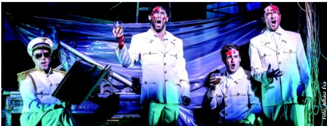
Kurázi mama és gyermekei