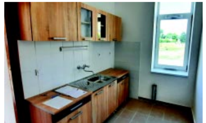
A Huszár lakótelepen és a város már részein is sok bérlakást újítottak fel a bontásokkal párhuzamosan

A Szociális városrehabilitációs projekt keretében összesen 186 lakás újult meg. Ezek közül 77 lakás külső és belső felújításon esett át, 109 pedig külsőleg újult meg, hőszigeteléssel és tetőcserével. A sajtótájékoztatón elhangzott: a Keleti lakótelep elbontásával így létrejött egy fejlesztési terület, amelyet a város hosszú távú érdekeit figyelembe véve alakítanak majd ki.