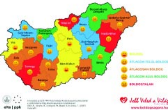
Magyarország Boldogságtérképe megyék szerint 2020-2021