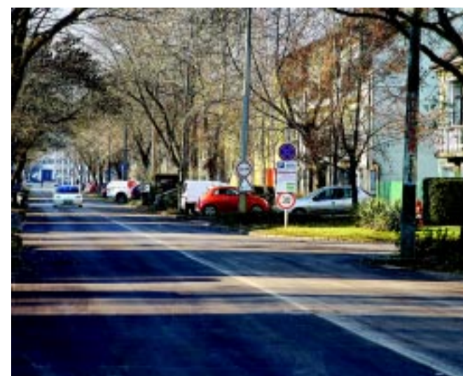
A Bujtos utca újraszafalozásával is emelkedett a közlekedés színvonala a városban