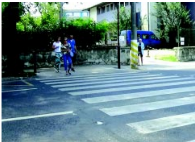
Egy nyári pillanat: a kórház előtti okoszebra is sokaknak segít

A Tiszavasvári úti felüljáró felújításával kapcsolatban az igazgató úgy nyilatkozott, a beruházás kiviteli terveit a