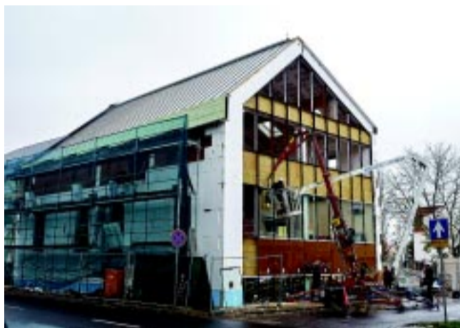
A Bocskai utca 16. szám alatti ház az épített örökség védelmének szellemében épül újjá és teljesen új funkciót kap

– Miközben folyamatosan a terveken dolgoznak a munkatársaink a földutak aszfaltozásához, azzal szembesülünk, hogy akik a legjobban kérték, már-már követelték, s hivatkoztak 15–25 éves ígéretekre, miután megterveztük, s jeleztük, egy-két méter szükséges az építéshez, azt már nem akarják odaadni. Érdekes helyzet, mert ez azzal is járhat, hogy nem tudunk mindenhol utat építeni, ahol szeretnénk. Pedig a kiviteli terveket már jó előre elkészítettük azért, hogyha kedvező helyzetbe kerülünk, akkor kihasználva a lehetőségeket, meg tudjuk csinálni. Érthetetlen, hogy olyan utcákban, ahol akár 80–100 milliós ingatlanok vannak, nem adják át azt a néhány tízezer forintos részt, pedig az új út az életminőségük mellett a házaik