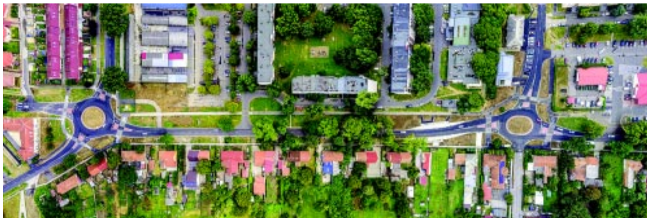
Madártávlatból rajzolódik ki igazán a két idén átadott örökösöldi körforgalom fontossága

A polgármester kiemelte, várhatóan nehezebb időszak lesz, mint tavasszal, de közben sok jó dolog is történik Nyíregyházán, hiszen futnak olyan programok, amik a város építését szolgálják. – Ezek is igényelnek döntéseket. Csak kedden délután bizottsági hatáskörben három határozatot írtam alá a beruházások kapcsán. Tudni kell, hogy a veszélyhelyzetben meghozott határozatok egy része a most is zajló, vagy előkészítés alatt lévő fejlesztésekhez kapcsolódik, melyek a különböző stációkban azonnali lépéseket igényelnek. A tavaszi negyedévben egyébként 118 döntés született.