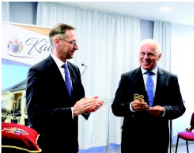
A teljesen felújított, átalakított Kállay-ház értékörzés és kulturális attrakció is egyben. A képen az ünnepélyes avatáson a polgármester Varga Mihály pénzügyminiszterrel.

A közgyűlés és a bizottságok nem működnek a veszélyhelyzetben, a közgyűlési bizottságok hatáskörében a polgármester hoz döntéseket, amiről majd a veszélyhelyzet elmúltával beszámol a közgyűlésnek – tájékoztatott dr. Kovács Ferenc.