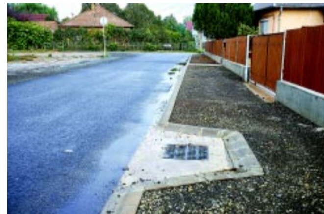
A Gálya utca jó példa: ha együttműködik a kérelmező lakosság, épülhetnek az utak