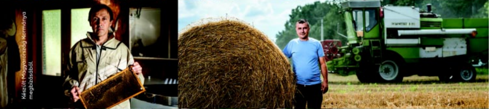
Készült Magyarország Kormányára megbízásból.