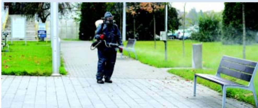
A NYÍRVV Nonprofit Kft. munkatársai szerdán reggel a Szabadság téri utcabútorokat fertőtlenítették