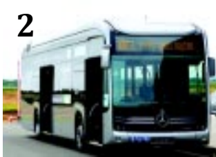
ZÖLD BUSZ PROJEKT