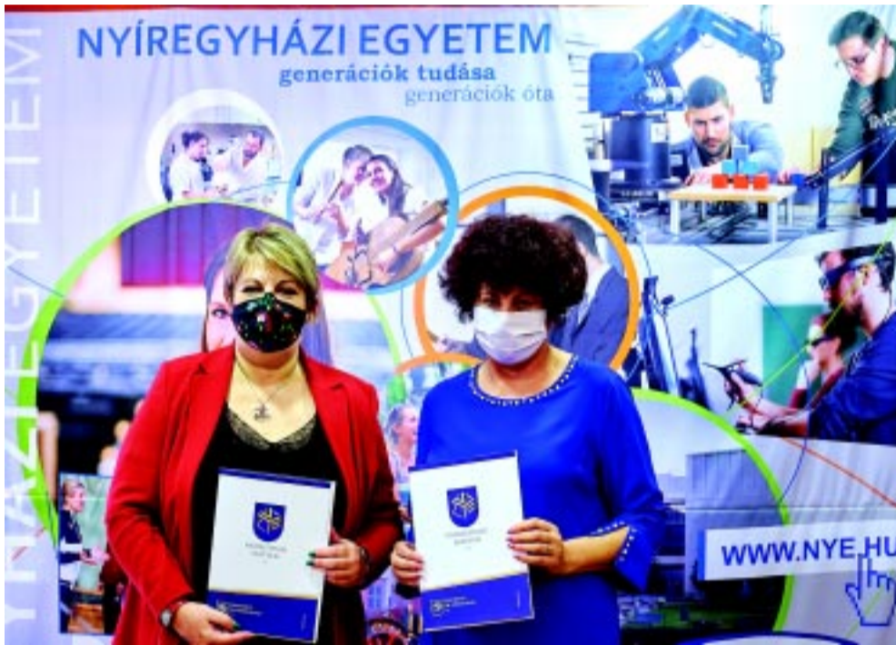
A rektor és a főigazgató a megállapodás szentesítését követően, a pandémiás előírásokra is ügyelve