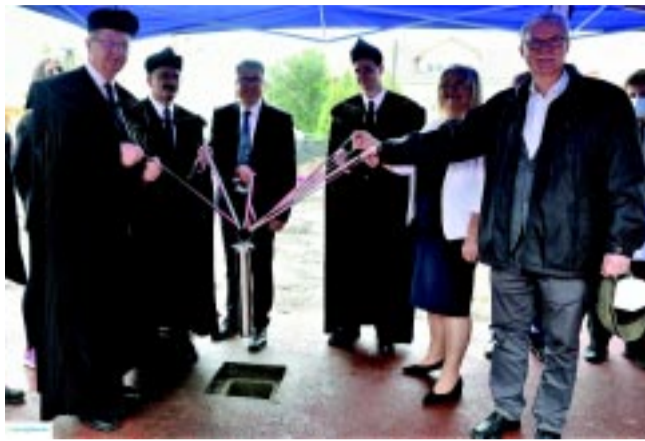
Letették az új épületszárny alapkövét

– Iskolánk 115 esztendeje a város egyik szellemi műhelye, 25 éve keresztyén küldetése van, alapításától kezdve több család választotta gyermeke számára, mint amennyi hely van az épületeinkben. Az 1932/33-as tanév végén,