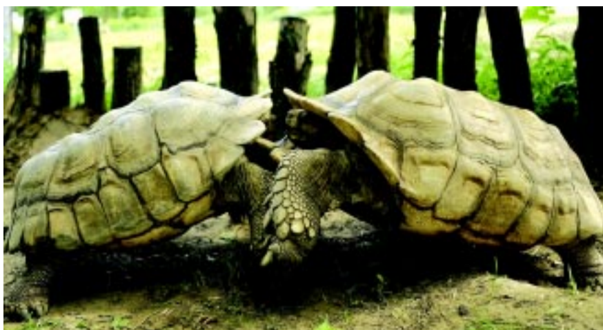
Sarkantyús teknősök. 2 hím a nőtények kegyeiért harcol

A HÓPÁRDUC ÉS A KIS PANDA MOST SOKKAL AKTÍVABBAK!