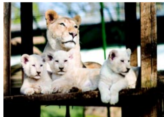
A fehér oroszlánkölyök anyjukkal

Bár az előrejelzések szerint leghamarabb csak egy hónap múlva van esély arra, hogy leessen az első hó, már most folyamatosan hűl le a levegő. Ilyenkor pedig nemcsak az emberek, hanem az állatok is fáznak. Éppen ezért a Nyíregyházi Állatparkban már javában zajlik a téliesítés. A sarkantyús teknősök sem sütkéreznek kint, bekerültek a fűtött állatházba és többek között az apró karmosmajmok is a belső kifutót részesítik előnyben. Nem úgy, mint a rendkívül ritka hópárduc, a kis panda vagy a szibériai tigris, akik kint sokkal aktívabbak most, mint a nyári időszakban.