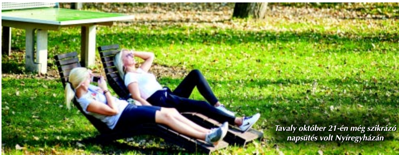
Tavaly október 21-én még szikrázó napsütés volt Nyíregyházán

– Aki várja az indián nyarat, annak rossz hírem van. Októberben végig maximum 15 fokos nappali hőmérséklet lesz, e fölé pedig nem megy majd a hőmérő higany-