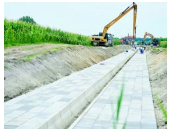
Látványos a Nyulastói csatorna rekonstrukciója

szolgál a Westsik Vilmos utca felől érkező csapadékvíznek – sokat segítve a nyírszőlősieknek. Folyamatban van a Csemete utca csapadékvíz-elvezető hálózatának kiépítése zárt csatornával, záportározóval és nyílt árkos elvezetéssel. Az új hálózat kapcsolódni fog a korábban elkészített csapadékhálózat-rekonstrukcióhoz, amely a Tünde, az Alma, a Lujza és a Tüzer utcán halad keresztül. Az Igrice (VIII/1.) főfolyás Berenát utcától északra eső részének kapacitásnövelése is tart mederburkolással és mederkotrással, mellyel javul a vízszállító képessége. Az Igrice csatorna a belváros és a település keleti felének vízelvezetését biztosítja. E kivitelezések összértéke bruttó 655 millió forint, várható befejezésük augusztus-szeptember. Ám januárra már elkészült a program részeként – lokális vízelvezetési problémákat megoldva – az Alma utca csapadékvíz-elvezetésének rekonstrukciója a Málna utca és a Rezeda utca között, a Kökény utca 75. és 115. szám környékén az elöntést mentesítő csapadékvíz-átemelők építése, utóbbi helyszínen záportározóval.