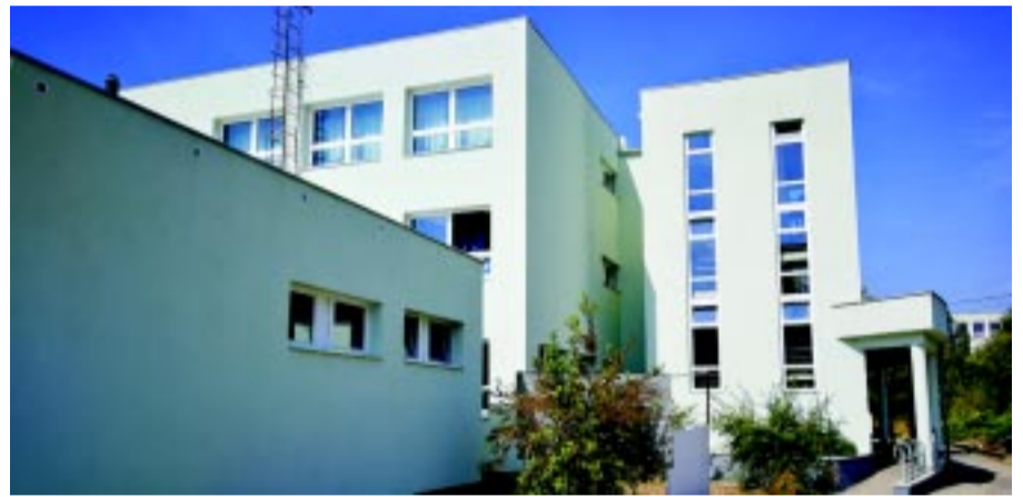
Bem József Általános Iskola Gárdonyi Géza Tagintézmény