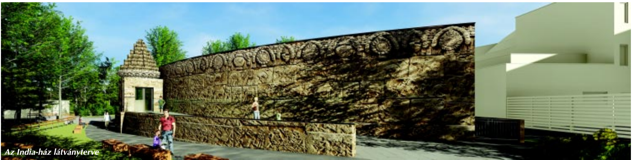
Az India-ház látványterve

Egyedi. Különleges. Megismételhetetlen. Leginkább ezekkel lehetne jellemezni a Nyíregyházi Állatpark fejlesztéseit és az ott dolgozók kerítésen belül és azon kívül zajló tudományos munkáját, amelynek köszönhetően (is) szinte minden hónapban új jövevényekről számolnak be. Ezeket az állatokat pedig nem is akármilyen környezetben mutatják be a látogatóknak. A fejlesztéssorozat folytatódik, várhatóan év végére elkészül az India-ház is.