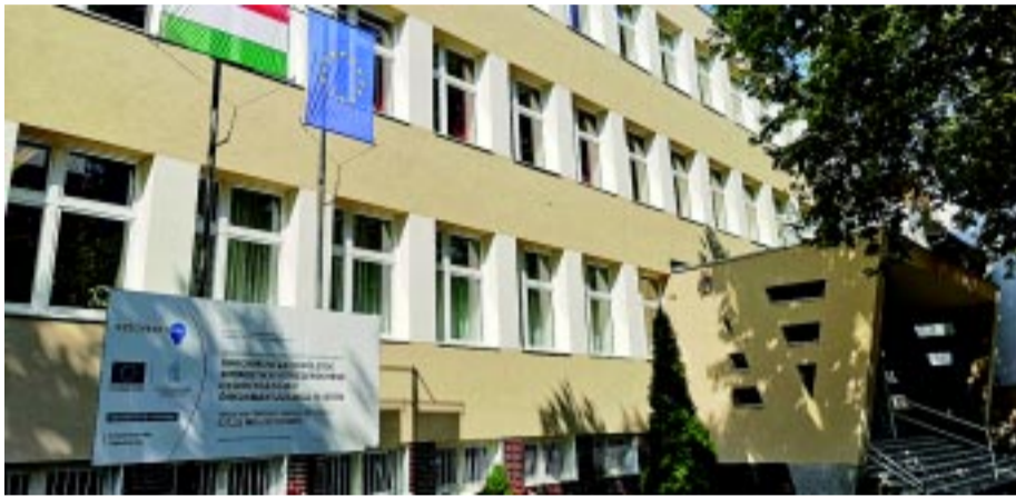
Nyíregyházi SZC Vásárhelyi Pál Építőipari és Környezetvédelmi-Vízügyi Szakgimnáziuma

A fejlesztés keretében az alábbi intézmények újultak meg: