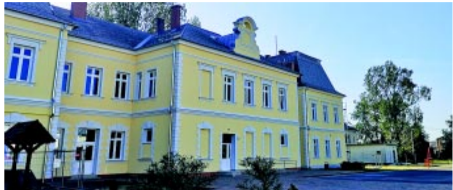
Sója Miklós Görögkatolikus Általános Iskola