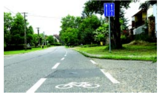
A Fürdő utcán kialakított megoldás nem egyedi

A Fürdő utcán középen egyetlen forgalmi sáv található, a két szélre pedig fel lett festve a nyitott kerékpársáv. Itt a járművek a forgalmi sávban haladnak mindaddig, amíg szemből másik jármű nem érkezik. Ekkor a nyitott kerékpársáv igénybevételével térnek ki egymás elől. Értelemszerűen ilyen forgalomtechnikai megoldást ott lehet alkalmazni, ahol relatíve kevés jármű közlekedik és az adott útszakasz forgalomcsillapítása a cél.