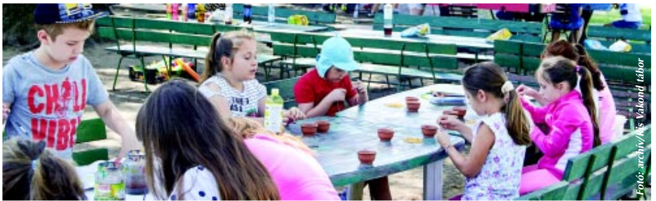
Fotó: archiv/ks Vakond tábor

Jászai Menyhért kérdésünkre hozzátette, közel három hónapon keresztül figyelt rá az önkormányzat a pandémiás időszak kezdetétől, hogy minden rászoruló gyermek kapjon ételt. Sőt, aki nem volt rászoruló kategóriában, de igényelte, azokat is el tudta látni a város, ami nagy könnyebbség volt a szülőknek, gyermekeknek egyaránt. Az alpolgármester hangsúlyozta, bár a koronavírus-világjárvány okozta átmeneti helyzet befolyásolja a városkassza állapotát, nem lehet olyan költségvetési átalakítás, amely érintené akár az ét-