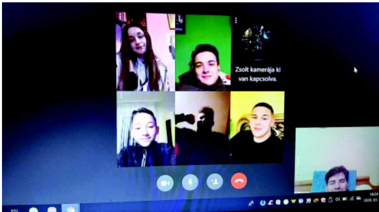
A pedagógus gyakorta videóhívás segítségével is tartja a kapcsolatot diákjaival

– Az osztályom most végzős, és igazából már ötödiktől kezdve működik egy közös Facebook csoportunk, amiben információkat osztunk meg egymással. Ezt korábban