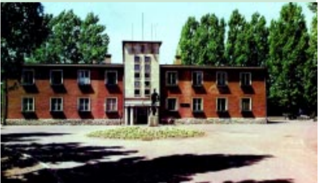
A Spartacus stadion főépülete 1969-ben