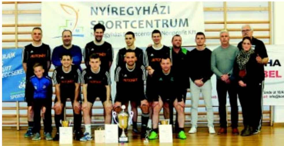
A 2019-2020-as teremlabdarúgó bajnok, az Autonet csapata