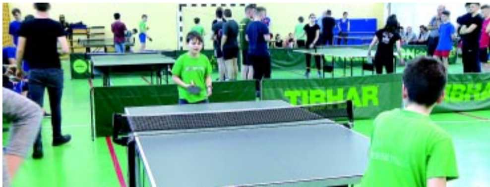
Megtelt a szőlőskerti iskola tornaterme asztaliteniszesezőkkel

A hagyományokhoz híven ismét megrendezték a kollégiumok megyei asztalitenisz-versenyét Nyírszőlősen. Idén már 14. alkalommal találkoztak a diákok. A megmérettetés egyben emléktorna is volt.