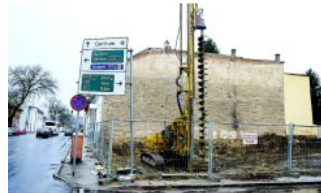
A beruházást nehezíti, hogy a szomszédos épületre is vigyázni kell

felmérés készítése volt javasolt és indokolt a szomszédos ingatlan állapotának megőrzése céljából, aminek részeként a kivitelező feltárásokat végzett. A mérés eredményeit a tervező és statikus részére is megküldte, s a részletes számítások felhasználásával átfogó jelentés készült.