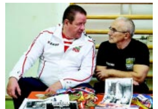
Ülőröplabda és erőemelés – mindkét sportág bemutatót tartott a Magyar Parasport Napján

– Az ép diákok példát vehetnek parasportolókról, akik szép sikereket értek el nem-