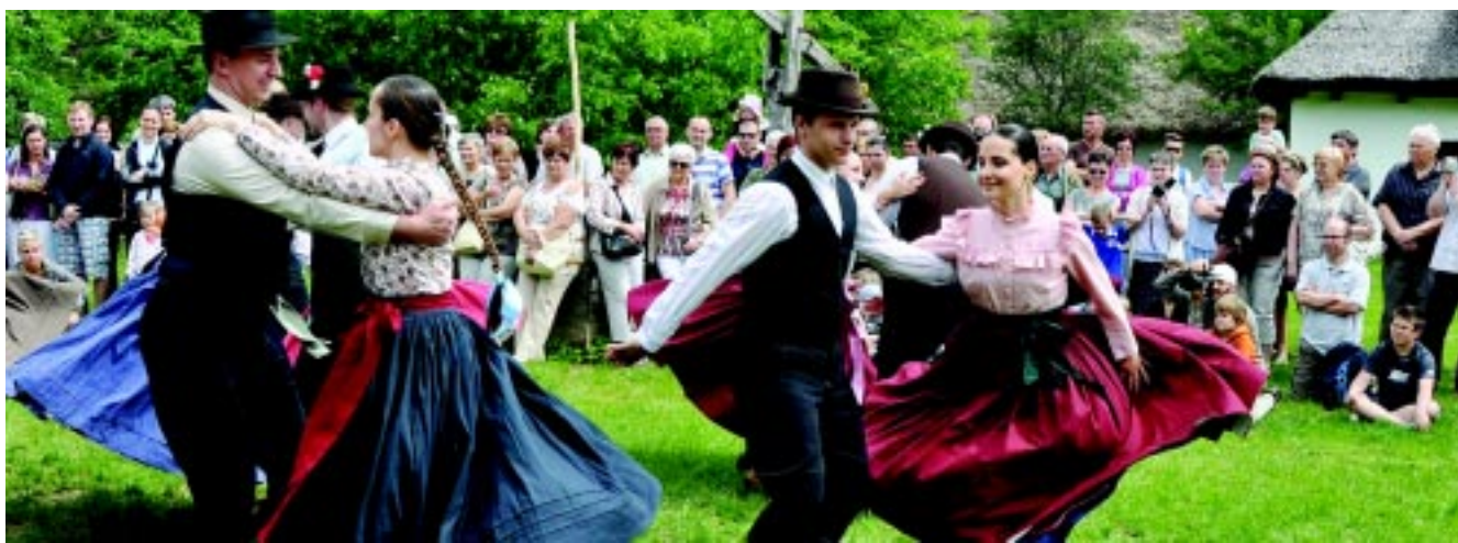
Nemsokára kizöldül a felújított múzeumfalú, amelynek pezsgő esztendeje lesz

A közel 890 milliós, TOP-os felújítás egyik eleme a megfiatalodott weboldal, melyen 50 év, 50 tárgy, 50 történet címmel blogot indítanak. Ez megmutatja a 40 ezres néprajzi gyűjtemény tárgyait, de megszólaltatja azokat az