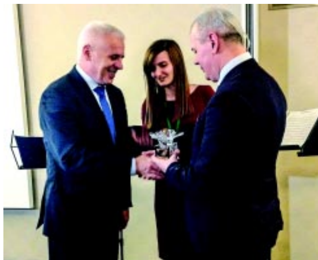
Ukrajnában vették át az elismerést

A konferencia célja a Kárpát-medence turisztikai és rekreációs vonzerejének bemutatása, valamint fejlesztése. A rendezvényen Ukrajna, Magyarország, Szlovákia, Lengyelország és Románia üdülővárosainak önkormányzati képviselői, wellnesslétesítményének küldöttei vettek részt.