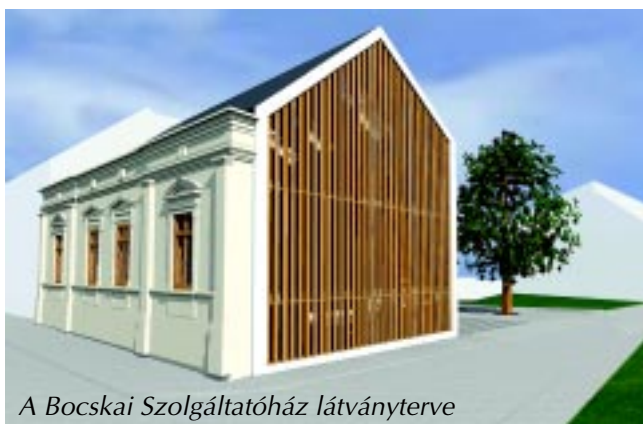
A Bocskai Szolgáltatóház látványterve

A szolgáltatóház kialakítása a gazdaság fejlődését, a foglalkoztatás bővülését is eredményezi, épületenergetikai szempontok, illetve akadálymentesítés figyelembevételével. A régi helyén egy új, háromszintes ház épül, a hozzá kapcsolódó valamennyi infrastrukturális és egyéb, az épület rendeltetészerű használatához szükséges léte-