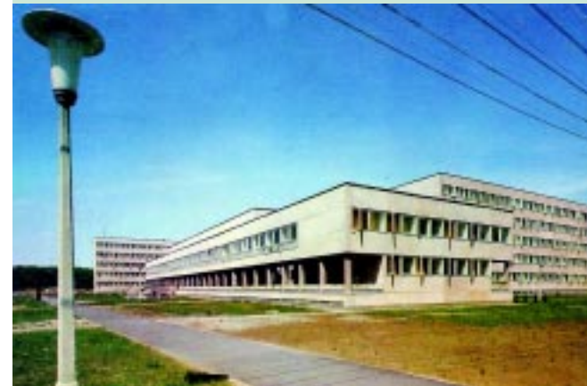
A Tanárképző Főiskola kollégiuma 1969-ben

A képen a Tanárképző Főiskola kollégiumi épületei, valamint a konyha és étkezdé láthatóak 1969-ben, a Sóstói út és a Stadion köz találkozásánál. A Tanárképző Főiskola nehéz körülmények között kezdte meg működését 1962-től, az akkor még Vasvári Pál utca 16. szám alatt működő Vasvári Pál Gimnáziumban, míg a kollégium a Sóstói út 2/A szám alatt kapott helyet. Az intézmény jelenlegi helyén 1965-ben kezdték meg az építkezést és az 1971/72-es tanévben már minden tanszék az új épületben kezdte el a munkát. Ebben az időben már 3000 hallgatója volt a főiskolának, míg a kollégium 900 fiatalnak nyújtott kényelmes, korszerű otthont. Nem sokkal később, 1972. október 6-án az intézmény felvette Bessenyei György nevét, amelyet 2000. január 1-ig viselt.