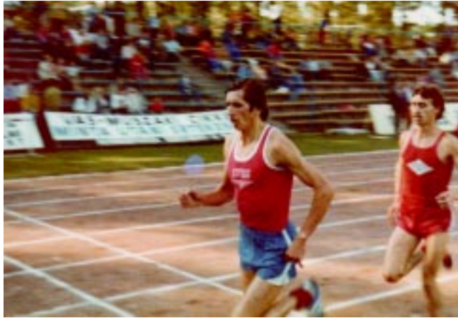
Nemzetközi verseny a Városi Stadion még salakos 400-as pályáján