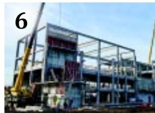
6 ATLÉTIKAI CENTRUM