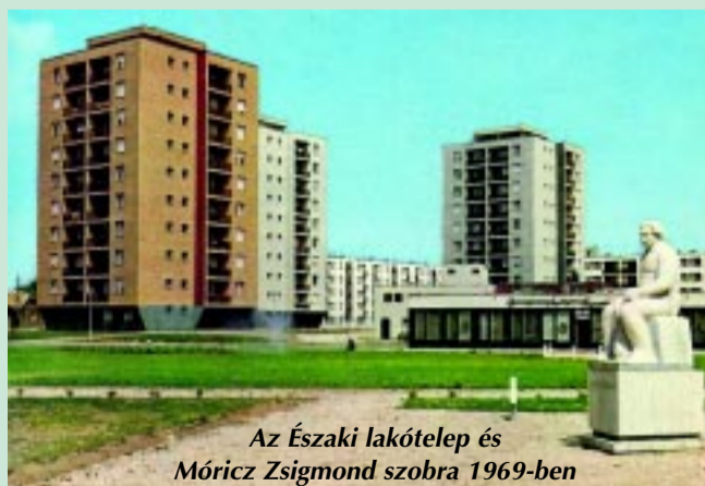
Az Északi lakótelep és Móricz Zsigmond szobra 1969-ben

Külön érdekesség, hogy a szobor ünnepélyes felavatására csak egy évvel később, 1962. szeptember 3-án került sor, amikor az író halálának 20. évfordulójáról is megemlékeztek. Már ekkor is többen megkérdőjelezték, hogy az emlékmű méltó helyen van-e, de a szobrot végül csak jóval később költöztették át, oda, ahol napjainkban is látható: a Bessenyei György Tanárképző Főiskola, azaz a mai Nyíregyházi Egyetem parkjában.