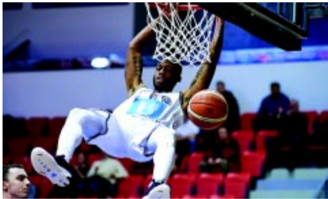
Az amerikai Hobbs húzóember a kosarasoknál

Egyre több lehetőséget kapnak a saját nevelésű fiata-