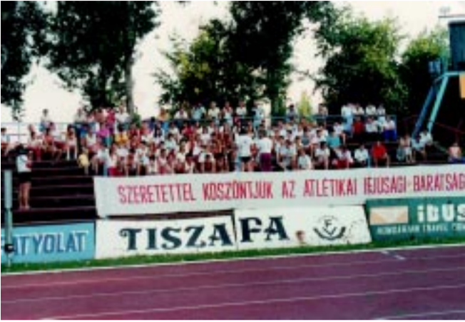
A műanyag borítású pálya az Atlétikai Ifjúsági Barátság Versenyén