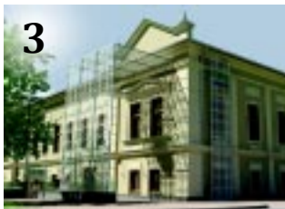
3 KULTURÁLIS NEGYED