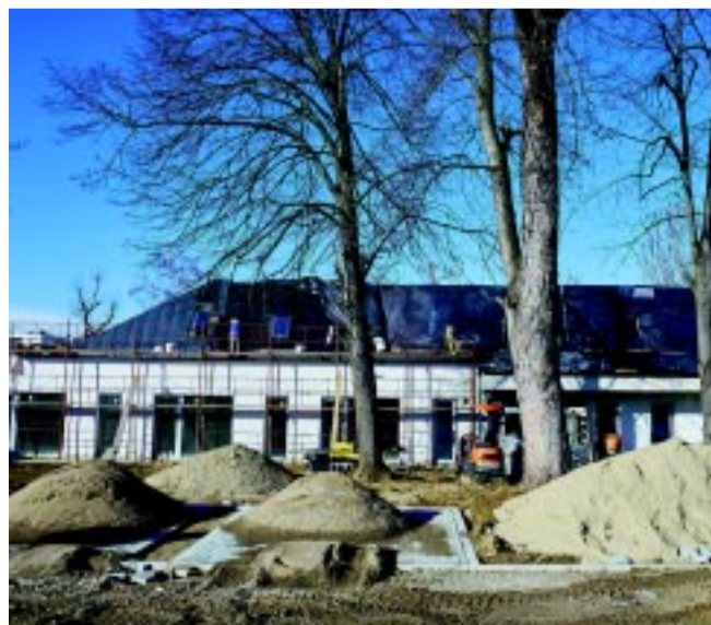
Az Őz utca 16. szám alatt épült az intézmény