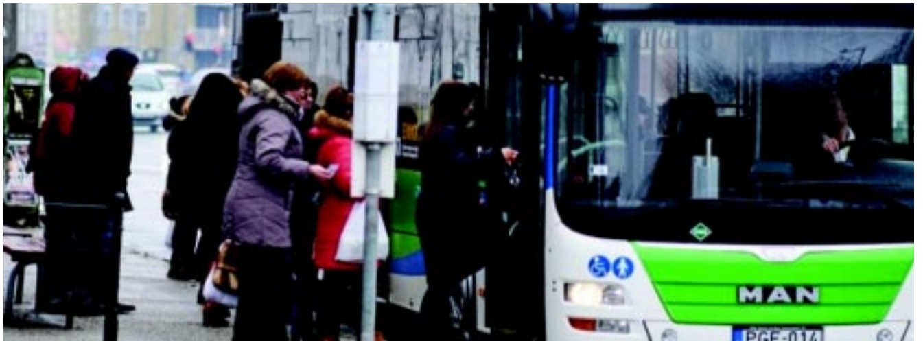
Az önkormányzat segítségével két évvel ezelőtt a városi buszflotta fele cserélődött le környezetbarát, gázüzemű járművekre

– De a közlekedésben is mind passzív, mind aktív fejlesztések történtek, korszerűsödtek az autók, illetve a sok