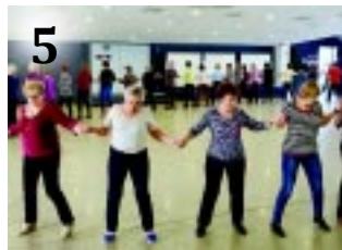
5 MOZDULJ NYÍREGYHÁZA!