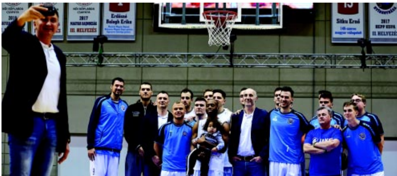
Győztes meccsek után szelfi. 2020-ban már több kép is készülhetett.