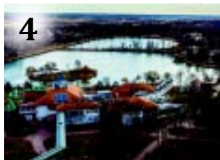
4 TOP 50