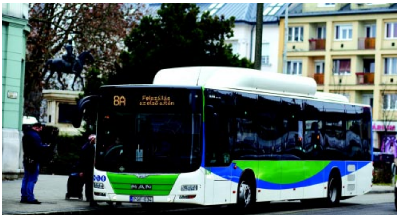
A 8A érkezik az Országzászló térre, egyelőre az átmeneti menetrend szerint

A beérkező visszajelzések alapján elmondható, hogy megosztottság alakult ki az Országzászló téren és a Bessenyei téren át vezető útvonal között. A válaszadók szerint a 6-6Y-66-os autóbuszcsalád, illetve a 90-es és 92-es autóbuszok útvonala az Országzászló téren át kedvezőbb, azonban a 8-8A és 10-10A autóbuszok esetében pedig a Bessenyei téren át való vonalvezetés a népszerűbb a válaszadók körében. A H40-es viszonylat útvonalvezetése a kérdőív válasza alapján nem eldönthető, mivel a szavazatok megoszlása 50-50 százalék a kétféle útvonal között.