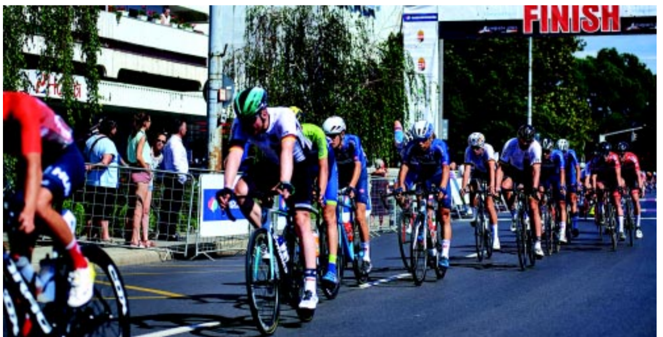
Rangos, nemzetközi kerékpárversenyeknek ad helyet folyamatosan Nyíregyháza

Eredetileg 2021-ben szerették volna megrendezni az Eb-t, de a koronavírus-járvány miatt egy évvel később tartják. Világtúráverseny viszont idén nyáron is lesz Nyíregyházán. Egy éve több helyszínen is szerettek