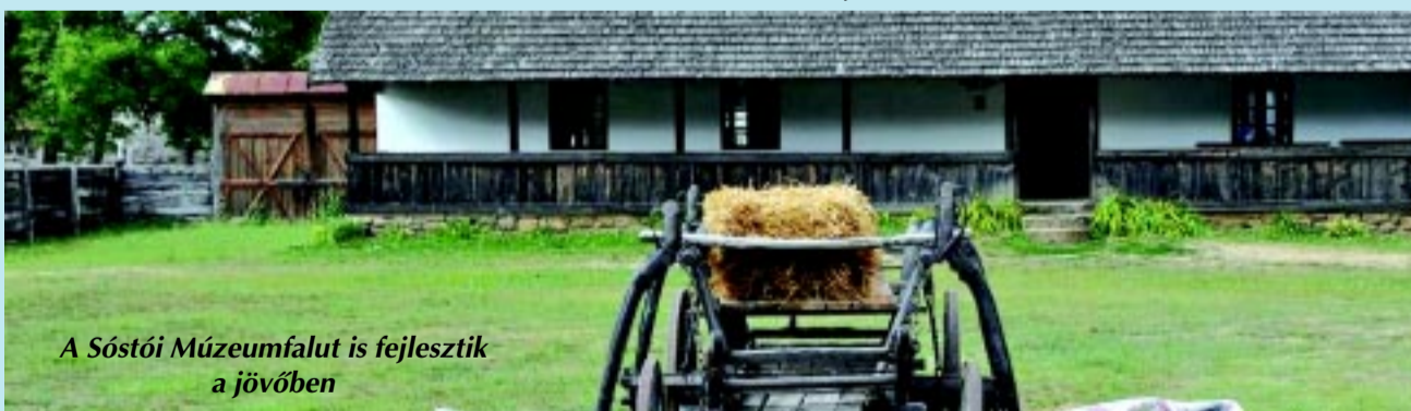
A Sóstói Múzeumfalut is fejlesztik a jövőben