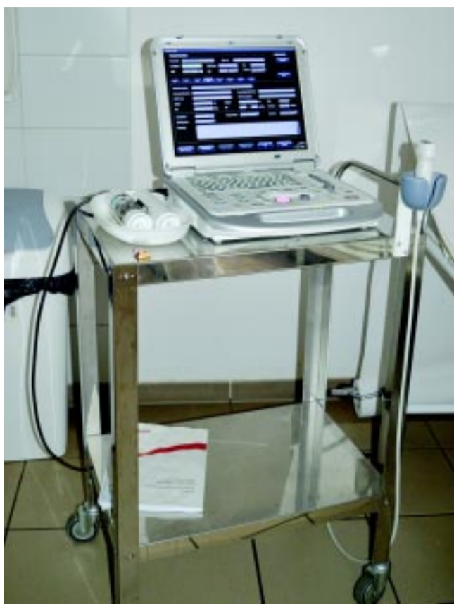
Több tízmilliós eszközállománnyal is gyarapodtak az osztályok. Képünkön egy ilyen a sok közül.

A program legfontosabb célkitűzése az idős betegek ápolási körülményeinek javítása, és a hozzátartozók otthoni ápolással kapcsolatos ismereteinek fejlesztése, hiszen sokat segíthet, ha megszokott környezetükben, családjuk körében kaphatják meg a megfelelő ellátást. Ennek érdekében otthoni ápolással kapcsolatos oktatásokat kívánnak szervezni idős betegek hozzátartozói részére. Ezeket a foglalkozásokon, ismereteik, tapasztalataik átadásával a nővérek, ápolók segíthetnek felkészülni a hozzátartozóknak az idős szeretteik gondozásával járó nehézségekre. A befolyt összegeket az ápolási munkát segítő eszközök be-