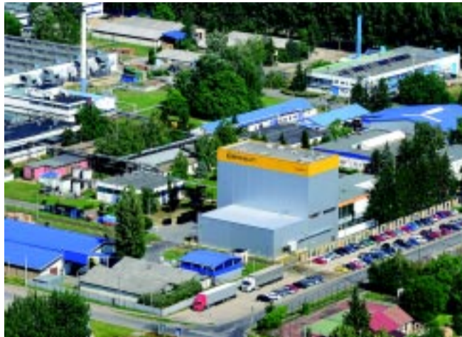
A ContiTech-nél folyamatos a munkahelyteremtés a beruházások következtében

„A ContiTech Magyarország Kft.-nél, a Continental nyíregyházi telephelyén a korábbi években és a jelenleg is zajló fejlesztéseknek köszönhetően a cég stabil háttérrel rendelkezik. Az egyik legfontosabb mérföldkő a személygépkocsi hűtőfűtő tömlők gyártásának beindítása a Volkswagen valamennyi európai gyára számára, melynek fejlesztését a második kaucsuk-keverék keverősor beüzemelése mellett a jövő évre tervezzük. Az új technológiai beruházásokat, a meglévő késztermék és egyes légrugó termékek gyártáskapacitásának bővítését új logisztikai épület is követi. A kaucsuk-keverő centrumunk egy kétszintes (2000 négyzetméteres) rak-