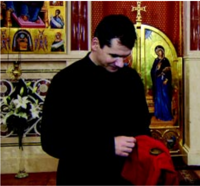
Egy piros kendőbe csomagolva érkezett az ereklye

Egy piros kendőbe csomagolva érkezett Nyíregyházára Szent Miklós ereklyéje. Egy apró, kerek, üvegtetejű dobozról van szó, amiben egy csontdarab látható. Körül