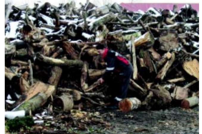
Ez a farakás is arra vár a NYÍRVV telephelyén, hogy kályhába kerülve a rászoruló családok otthonait melegítse