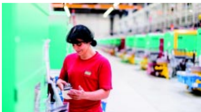
A LEGO terve továbbra is egyértelmű – a kapacitás növelése

„A 2014-ben átadott, mintegy 122 000 négyzetméteres új LEGO gyár egyes termelési területei a kapacitásigény növekedése miatt hamar szűkösen bizonyultak. Mivel a termelési kapacitásunkat folyamatosan a piaci kereslethez igazítjuk, egy újabb beruházás keretében tovább építjük a gyárunkat. A jelenleg már javában zajló bővítés a tervek szerint mintegy felével növeli meg a gyár területét, új termelőcsarnokok, kiszolgálóhelyiségek, kézi és automata raktárak épülnek. Emellett új technológiák te-