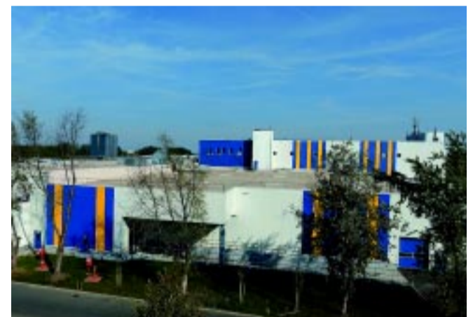
A Michelin még 2015-ben indított jelentős beruházást, aminek már látszik az eredménye

„A Michelin Hungária Kft. nyíregyházi személyabroncsgyárában olyan autókra készülnek abroncsok, mint a Porsche, a Ferrari vagy a Land Rover. A szupersport szegmens piaci elvárásainak megfelelően a kiegészítők, gyakori méretváltást igénylő, kiváló teljesítményű termékek gyártása különleges szakértelmet kíván. A gyár folyamatosan alkalmazkodik a vevői igényekhez. A 2015-ben indított, 40 millió eurós beruházás eredményeként 100 új munkahely jött létre. Megkezdődhetett az újfajta, defektűző abroncsok gyártása