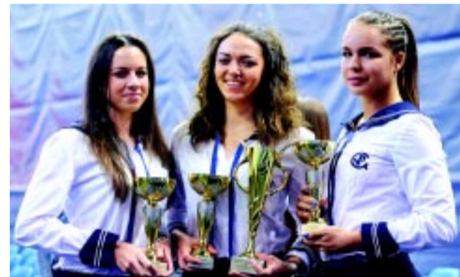
A Vasvári Pál Gimnázium röplabdás lányai idén is taroltak