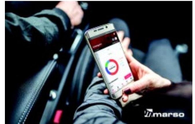
A MARSO-nál egyre nagyobb szerep jut a digitalizációnak

„A MARSO Kft. jövője az innovációban rejlik. Az informatikai fejlesztésekre és a vevői elégedettséget szolgáló új, „mobil- és okoskészülék-barát” megoldásokra koncentrálnak. 2017-ben elsőként jelentünk meg a piacon MARSOPONT mobilalkalmazásunkkal, amivel többek között egyszerű időpontot foglalni szervizeinkbe, lehetőséget nyújt az autók költségeinek nyilvántartásában, sőt, a jövőben akár szervizkönyvként is szolgálhat. A technológiai fejlődés hihetetlenül gyorsan zajlik napjainkban és hoz újabbnál