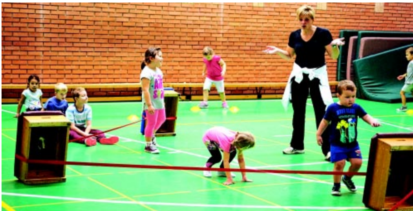
Zenes gyermektorna is várta a kicsiket minden hétfőn a Kodályban

A program sikerének fő kulcsa az emberi tényező: a benne részt vevők hozzáállása – emelte ki a sportrefe-