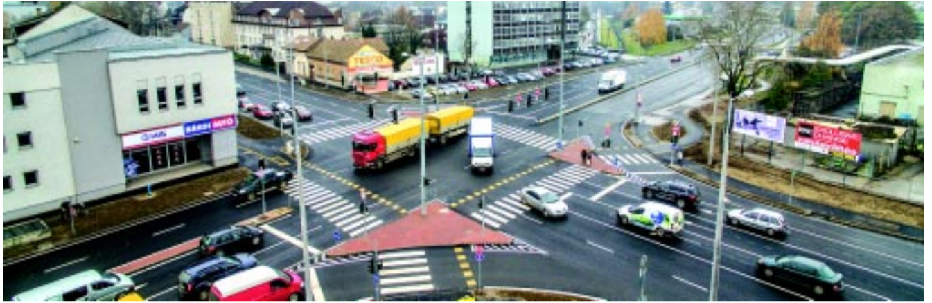
Madártávlatból látszik igazán, hogy a csomópont három jobbrakanyarodó sávval bővült, ami nagyban segíti a gyorsabb áthaladást

– Az átépítést és a forgalmi rend megváltoztatását a csomópont áteresztőképességének növelése indokolta a főirányok összehangolásának biztosításával – erősítette meg szintén kérdésünkre adott válaszában a Magyar Közút