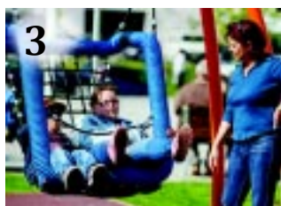
3 NYÍREGYHÁZI MINTA

MUNKAHELYTEREMTÉS. Újabb gyorsétteremmel gazdagodik Nyíregyháza: a KFC a Kert utcában nyílik meg rövidesen.