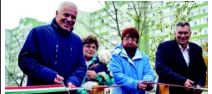
A polgármester és a képviselő a lakosokkal együtt avatta a kutyafuttatót

Csak pórázon lehet kutyát sétáltatni városunkban, a szabályozás 2014. január elsején lépett hatályba. Aki nem tesz eleget az önkormányzati rendeletben foglaltaknak, szabálysértést követ el és akár bírságra is számíthat. Az ebtulajdonosok azonban egyre több, kijelölt és zárt helyen sétáltathatják és tréningezhetik kedvenceiket. Dr. Kovács Ferenc polgármester az átadáson elmondta: – Tizenkét kijelölt kutyafuttató terület van városunkban, ebből három év alatt már hat helyszínen létesítettünk bekerített kutyafuttatókat. 2017-ben a Homok soron és a Malomkertben. Azért fontos a fejlesztés, mert nagy rá az igény, hiszen sok a kutyatulajdonos. Ahhoz, hogy a szabályt be tudjuk tartatni, vagyis csak pórázon lehet kutyát sétáltatni a városban, biztosítani kell olyan helyeket, ahol ezt szabadon megtehetik. Erre pedig jó példa a Homok sori kutyafuttató.