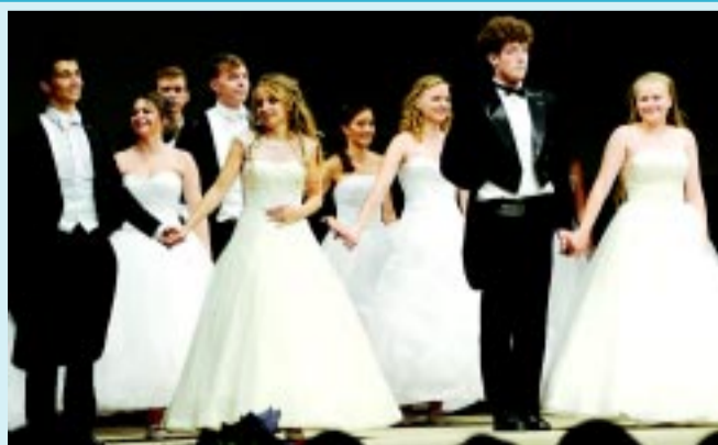
A Krúdy Gyula Gimnázium végzőseinek műsora

Ezúttal a Krúdy érettségizőinek produkcióiból láthatnak válogatást, szombaton 20.30-kor, ismétlésben vasárnap 9.30-kor és 22.00-kor, valamint szerdán 20.00-tól.