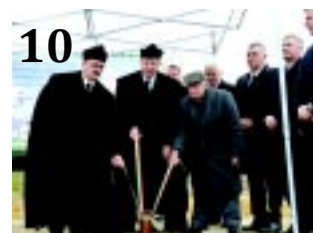
10 TEMPLOM ÉPÜL