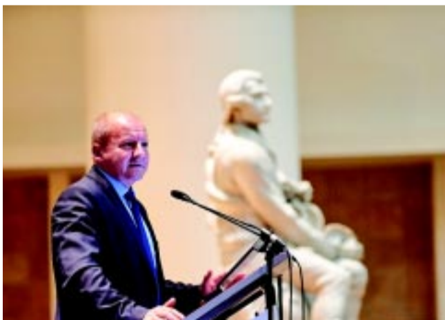
Dr. Simicskó István fórumon beszélt a haza védelméről

– Most jelenleg 23 ország írta alá a szándéknyilatkozatot, tehát a szándék az egyértelmű. Ezt mi kezdeményeztük annak érdekében, hogy legyen egy olyan katonai képessége az Európai Uniónak, amellyel a külső határokat