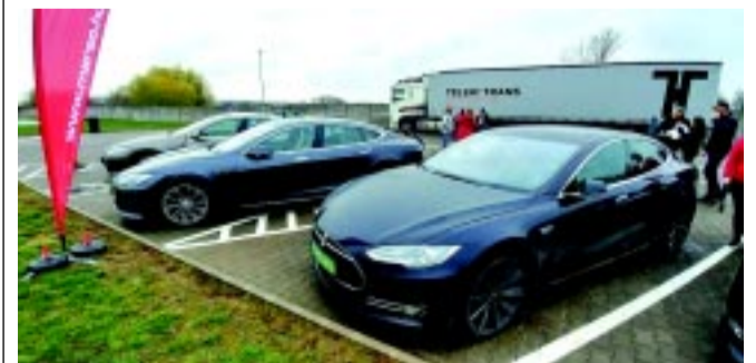
Közel 300 km-t tett meg a Nyíregyházáról indult konvoj

A konvoj tíz órakor indult el Nyíregyházáról, a MARSO Kft. székhelyétől és délután kettőre érkezett meg Zsámbékra. Ilyen még nem volt Magyarországon, és Európában is különlegesnek számít. A kísérlettel a szervezők a műszaki fejlődésre és a környezettudatos életszemléletre hívták fel a figyelmet. Az is elképzelhető ugyanis, hogy a jövőben a mozgásukban korlátozottak is kényelmesen vezethetnek majd autót a járművek speciális átalakítása nélkül.