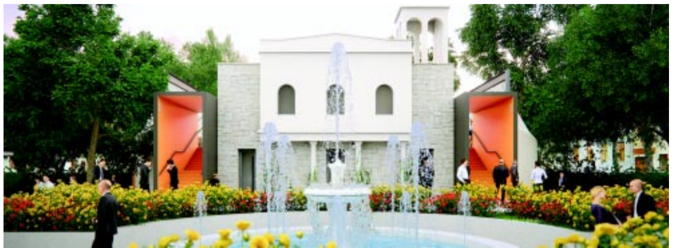
Ez az átalakuló szabadtéri rózsakertjének látványterve – ez alapján van növény bőven...

Az „egykori” Szabadtéri Színpad növényállománya részben ültetett: rózsakert, örökzöldek, és néhány, az akkori feltételeknek megfelelő helyre telepített lombos fa. Részben maghullásból betelepült, oda nem illő fa, amelyek nagy része a terület kerítésének a tövéből fejlődött ki, szabályozatlan módon. A projekt a színpad átépítésével annak térfoglalását is átalakítja, ebből – és a rendellenesen fejlődött növények elburjánzása miatt – adódóan szükséges volt fákat kivágni. Fontos megjegyezni, hogy az érintett területen áll a védett Taxodium distichum – Mocsárciprus, melynek fenntartandóságát, integrálását a tervező maximálisan figyelembe vette, azaz ezt a fajtát természetesen meghagyták.