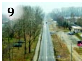
9 JÁRHATÓ A TÜNDE

KADÉTOK. Már a felhők felett repülnek az egykori nyíregyházi kadétek, hivatalos Wizz Air pilótaként.