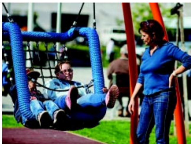
Képünk még meleg időben készült, de folyamatosan látogatják a gyerekek a játszótér

Az integrált játszópark ötletének megszületése után együttműködési megállapodás született a nyíregyházi önkormányzat és a Rotary Club között arról, hogy a világszervezet adományozók segítségével megvásárolja a park kialakításához szükséges játszótéri eszközöket, az ütéscsillapító gumitéglákat, a térburkoló anyagokat, a korlát-elemeket, majd átadja ezeket a városnak. Az önkormányzat pedig azt vállalta, hogy a játszóparkot megépíti, és gondoskodik az ütéscsillapító ágyak, a járda, a játszótéri eszközök között található sétányok, az öntözőrendszer, valamint az új gyepszőnyeg kialakításáról, amelyhez a forrást szintén a város biztosította, csakúgy, mint a telket.