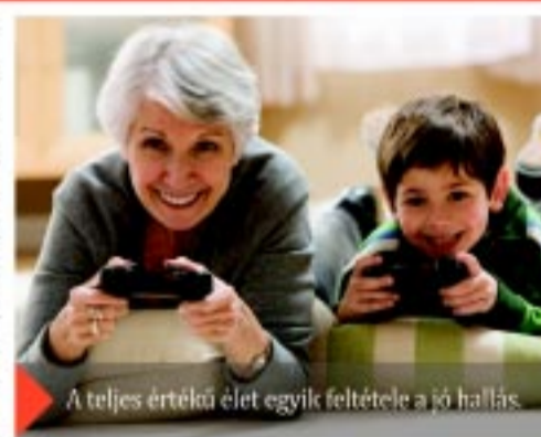
A teljes értékű élet egyik feltétele a jó hallás.

Jelentkezzen be most ingyenes hallásvizsgálatra az Önhöz legközelebb lévő Amplifon Hallásközpontba a 06 42 404 957-es telefonszámon!