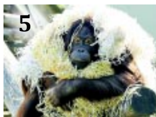
5 SZAVAZZ RÁM!