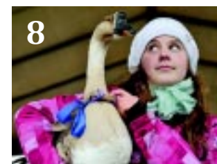
8 MÁRTON-NAP LESZ

KÖZLEKEDÉSFEJLESZTÉS. A képviselők több pályázat benyújtásáról is döntöttek az októberi közgyűlésen, a Korányin például még egy körforgalom épülhet.