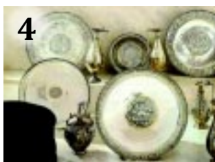
4 JÖNNEK A KINCSEK!

KRÍZISMEGBESZÉLÉS. Az önkormányzat koordinálásával a szakemberek az előző évekhez hasonlóan felkészülnek a várható rendkívüli hidegre.