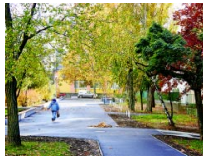
Ez a jóságvárosi szakasz csak egy, de fontos része az idei, több városrészt érintő járdarekonstrukciós folyamatnak