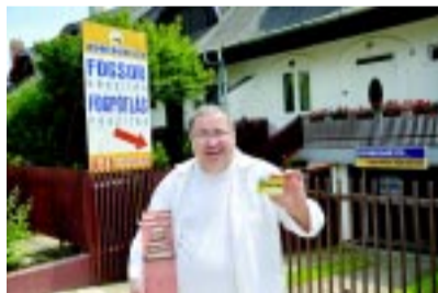
Életre szóló törhetetlenségi garancia

A világhírű eljárásokkal azokon segítenek, akiknek gondot okoz a viselés, különösen rágáskor. Akik pedig a régi fogsoruk helyett szeretnének a száj melegétől ínyükhöz idomuló hajlékonyt, nekik is van megoldás.