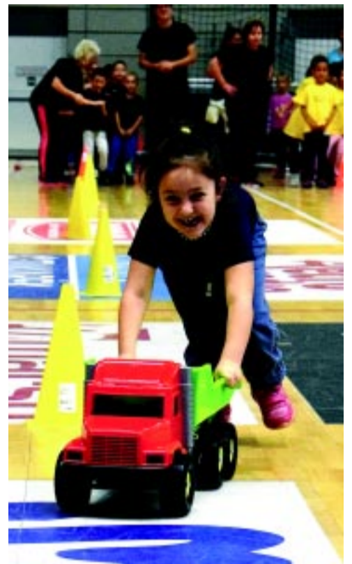
A dömperes feladat az óvisok egyik kedvence volt

– Természetesen olyan feladatokat kaptak az óvisok, melyeket könnyen teljesíthetnek, és sok-sok játékot is belecsempésztünk. A lényeg, hogy vidámak legyenek, jól