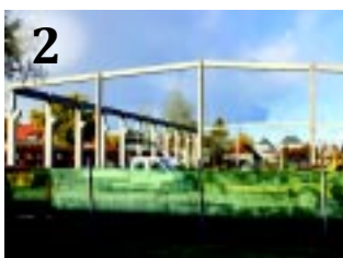
2 ÉPÜLŐ JÉGPÁLYA