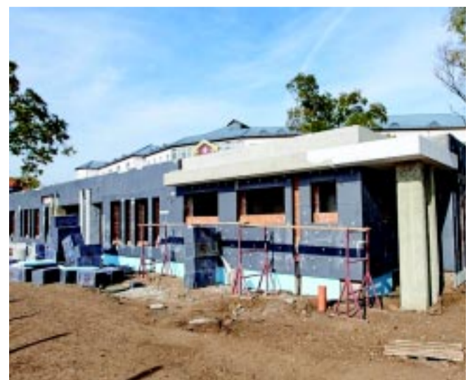
Már állnak a falai az új óvodának. Decemberre várhatóan be is fejeződnek a munkálatok