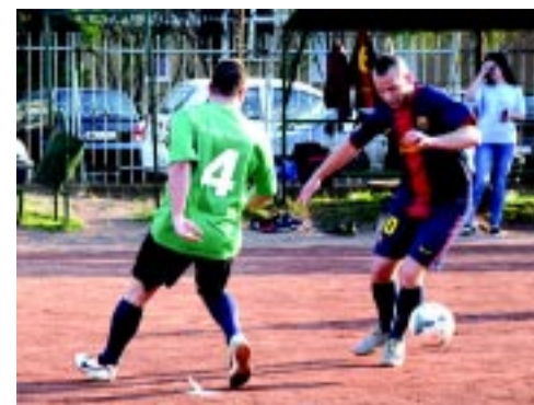
A szabadtéri szezon nagy csatákat hozott

120 csapat nevezett az idei Intersport Városi Kispályás bajnokságban. Az őszi szezonban több mint ötszáz meccset vívtak a csapatok, és parázs csatákat láthattak a Városi Stadionba kilátogató nézők. A szabadtéri meccsek után novemberben már a teremlabdarúgó-bajnokság indul.