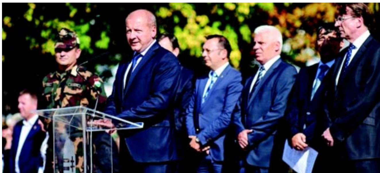
Dr. Simicskó István, honvédelmi miniszter Nyíregyházán köszöntötte a hazaérkező katonákat

Az ünnepségen dr. Kovács Ferenc polgármester is szólt. Azt mondta, megdöbbentés és öröm, hogy a komoly ka-