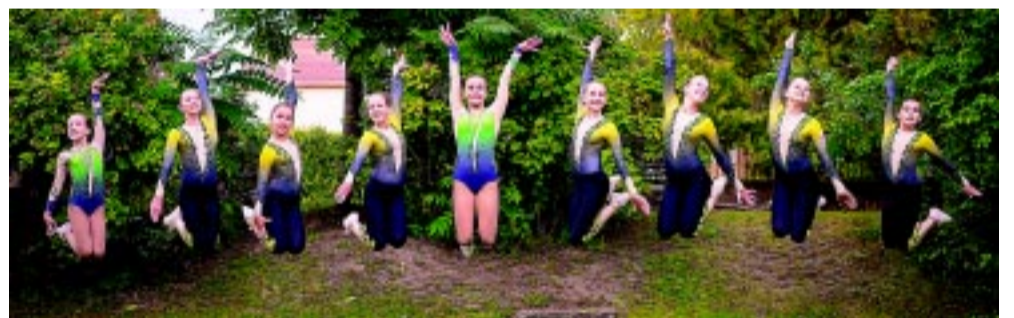
A nyíregyházi Flexi-Team több csapata is rajthoz áll

A hétvégén rendezik Nyíregyházán az Aerobik Magyar Kupa 3. fordulóját. 26 egyesület több mint 800 versenyzője vesz részt a Continental Arénában a kétnapos viadalon.