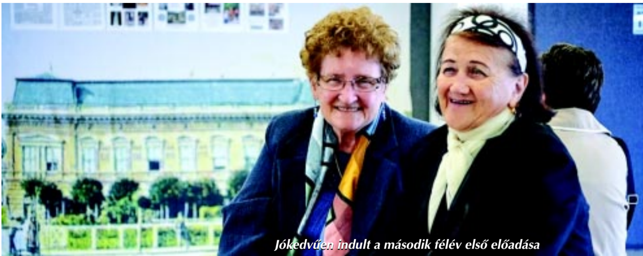
Jókedvűen indult a második félév első előadása

Újra megrendezi a Kelet-Magyarországi Szépkorúak Akadémiáját Nyíregyháza önkormányzata és a Debreceni Egyetem Egészségügyi Kara. Az őszi félév hat előadását továbbra is kéthetente szerdánként délután 15 órakor tartják a Váci Mihály Kulturális Központ harmadik emeleti hangversenytermében.