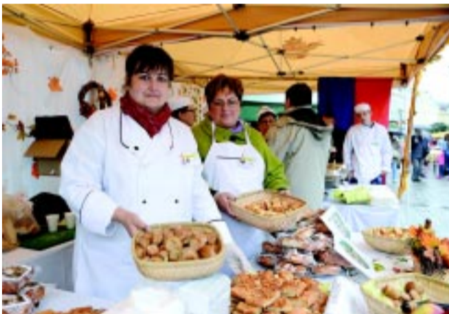
Desszertből sem volt hiány a fesztiválon