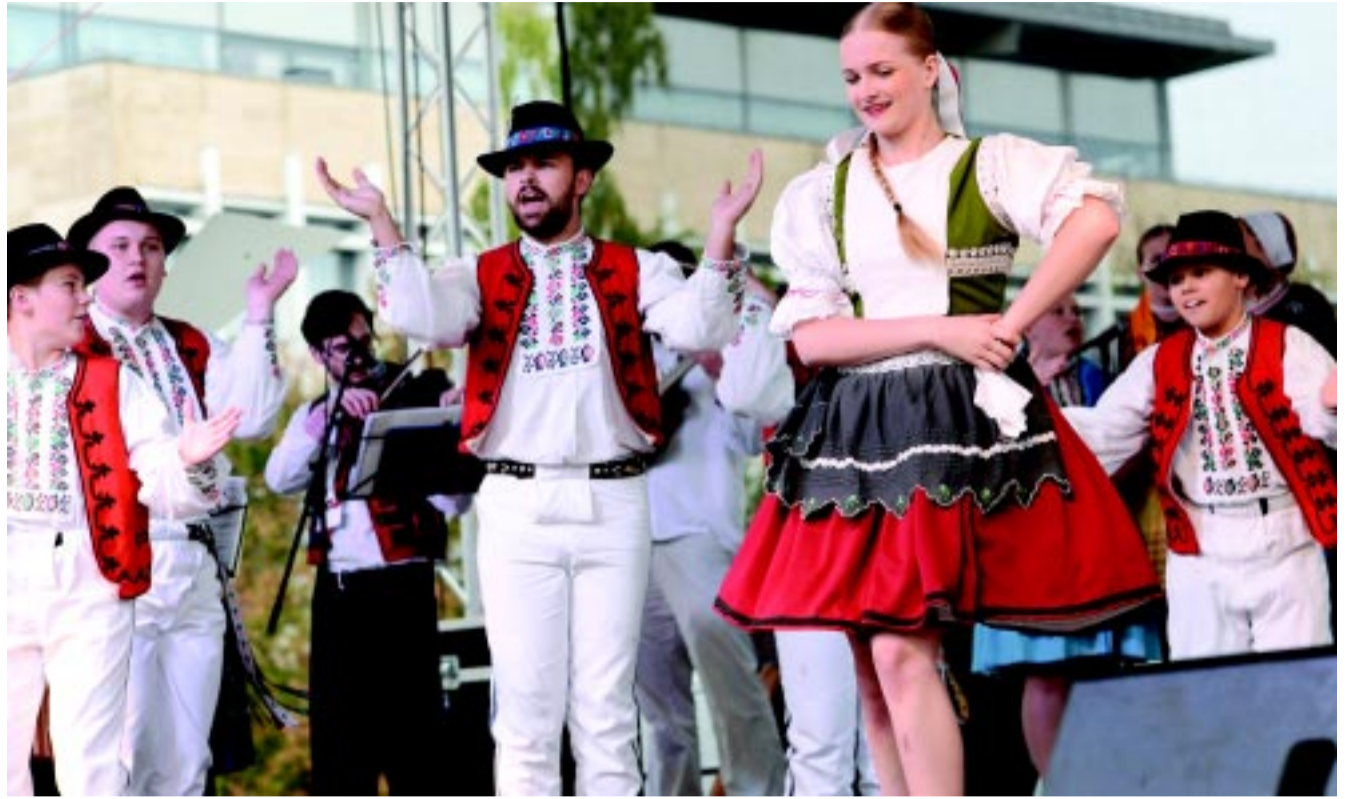
A 25 éve megalakult Rozmarija népi együttes Kelet-Szlovákia táncait és dallamait mutatta be Nyíregyházán