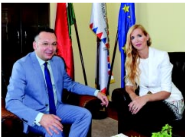
Dr. Szabó Tünde, az EMMI államtitkára és Román István, megyei kormány megbízott

– A feladatomból adódóan az ország számos pontján megfordultam és azt tapasztaltam, hogy az a kép, amely korábban kialakult a megyéről – akár bennünk is –, kezd megváltozni, átformálódni. Ma az itt élő emberek elmondhatják, hogy hozzátesznek az ország jó teljesítményéhez, és ki merem jelenteni, hogy van olyan térsége az országnak, amelyhez képest előrébb tartunk. Szabolcs-Szatmár-Bereg az ország egy fontos szeglete, elhelyezkedéséből fakadóan stratégiaileg is kiemelt terület. Azt látom, hogy a kormány is így tekint ránk, nem egy leszakadó, lemaradó országrészként, hanem egy sok potenciállal rendelkező feltörekvő megyeként. Megalapozott tervekkel és ötletekkel lehet forrást, kormányzati támogatást elnyerni. Hatá-