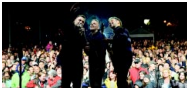
Retró party is volt a Kossuth téren