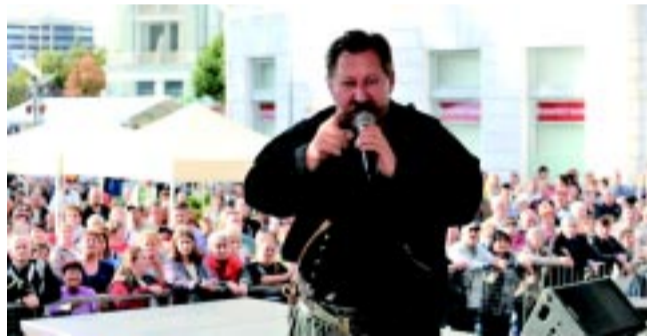
Vasárnap Laci betyár vigadója is kinyitotta kapuit