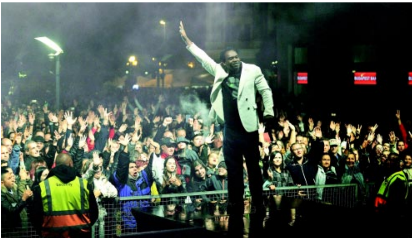
A hétvége sztárvendége a svéd Dr. Alban volt