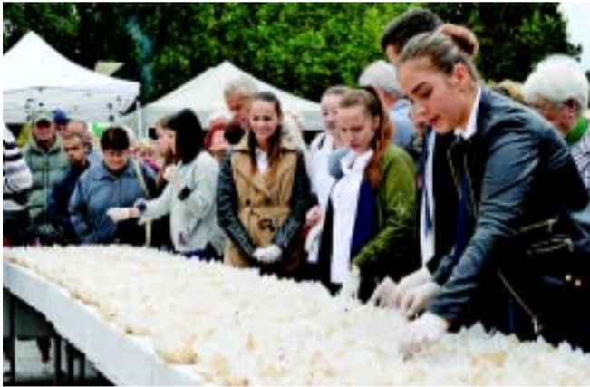
A sipkays diákok ezer adag szilvaslepénnyel lepték meg a városlakókat

A két napon át tartó fesztiválra testvér- és partnervárosok csapatai is eljöttek és főztek. Így szlovák, ukrán és lengyel különlegességekkel is meg lehetett ismerkedni. A jó ételekhez egész nap kiváló muzsika is társult, este pedig olyan retró partyn lehetett részt venni, melynek a svéd Dr. Alban volt a sztárvendége. A Tirpák Fesztivál vasárnap grillbajnoksággal folytatódott, majd a mulatós zene ismert alakjai zárták.