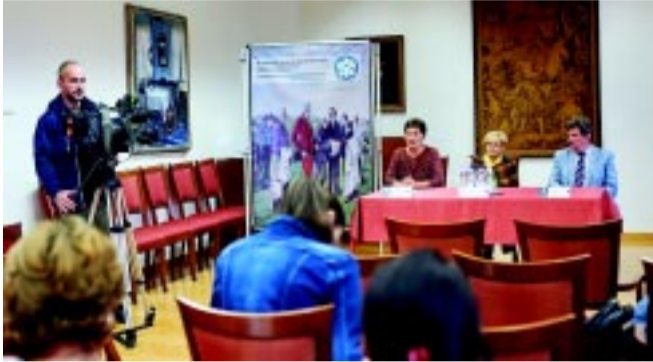
Bőséges kínálatot ígérnek a múzeumokban

Az ajtó nyitva áll – hirdeti a Múzeumok Őszi Fesztiválja idei szlogenje, mely szeptember 25-étől november 12-éig valóban nyitott ajtókat mutat mind a Jósza András Múzeum,