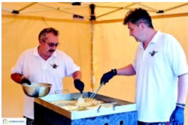
A Nyírségi Ízkirályok Egyesületének mesterei készítették a mindig népszerű lapcsánkát